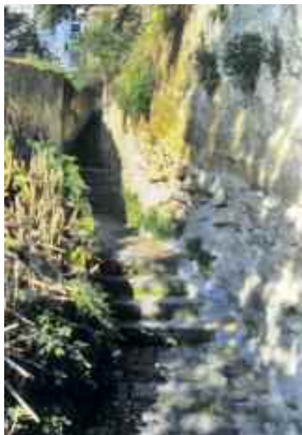
Fig. 12 - Napoli, parte finale del Canalone

po' di rovi ed un po' di spazzatura portata dalla pioggia, ma di monnezza, almeno in questi ultimi tempi, forse ne troviamo altrettanta nella elegante e centralissima via dei Mille.