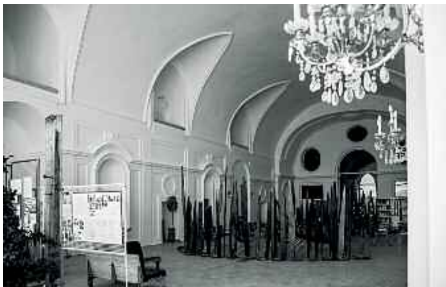
Fig. 41 - Teatro di Palazzo Donn'Anna