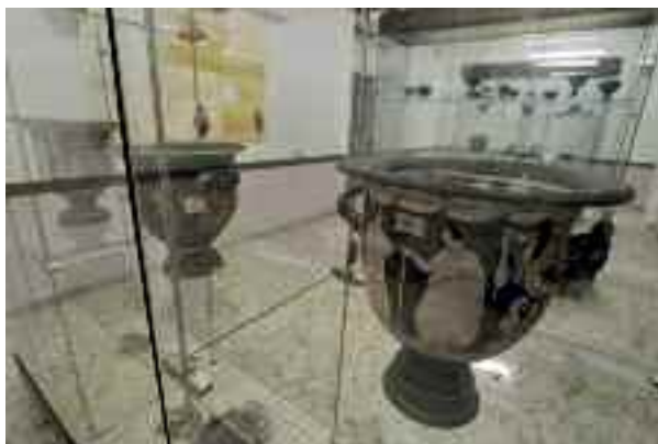
Fig. 5 - Serie di ceramiche a figure rosse

Gli Etruschi erano un popolo stanziatosi tra l'alto Lazio e l'attuale Toscana agli albori del VIII secolo a.C. L'Etruria, secondo Strabone, si estendeva sino al salernitano Agro Picentino, dove nacquero le città di Nola, Nocera, Ercolano, Pompei, Marcina, Velcha, Velsu, Irnthi, Uri Hyria, Capua, tra cui quest'ultima era quella egemone.