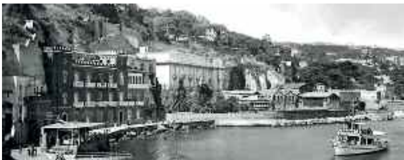
Fig. 13 - Riva fiorita

si raccontava avesse ospitato una cappellina dedicata all' Apostolo. Di quegli scogli, spianati dalla furia del mare, non resta nulla. È sempre off limits Villa D' Avalos, come Villa Peirce, divorate dall' invidia dei natanti in rada.