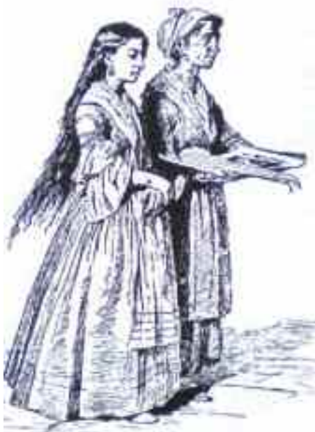
Fig. 2 - Fattucchiera vende candele per fidanzamenti, stampa ottocenteca