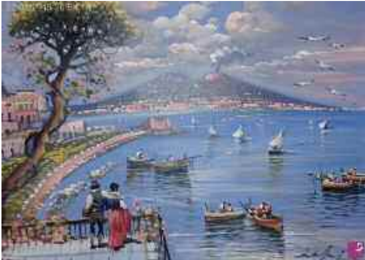
Fig. 5 - Veduta-di Napoli con il pino