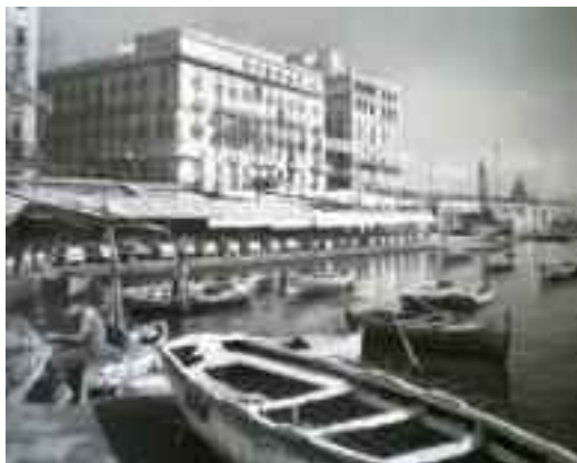
Fig. 9 - Il ristorante Zi Teresa

vongole, la parmigiana di melanzane, i polpi affogati e i meravigliosi frutti di mare. Arrivarono a sedersi ai suoi tavolini finanche teste coronate d'Europa e lei, che indossava il suo classico scialle e i suoi gioielli, senza mai montarsi la testa, continuava ad andare in cucina a controllare che tutto funzionasse secondo i suoi ordini e in giro per i tavoli a dispensare sorrisi e a chiedere pareri.