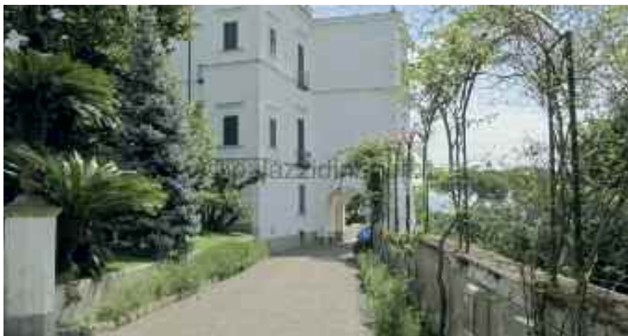
Fig. 46 - Villa Ruffo della Scaletta