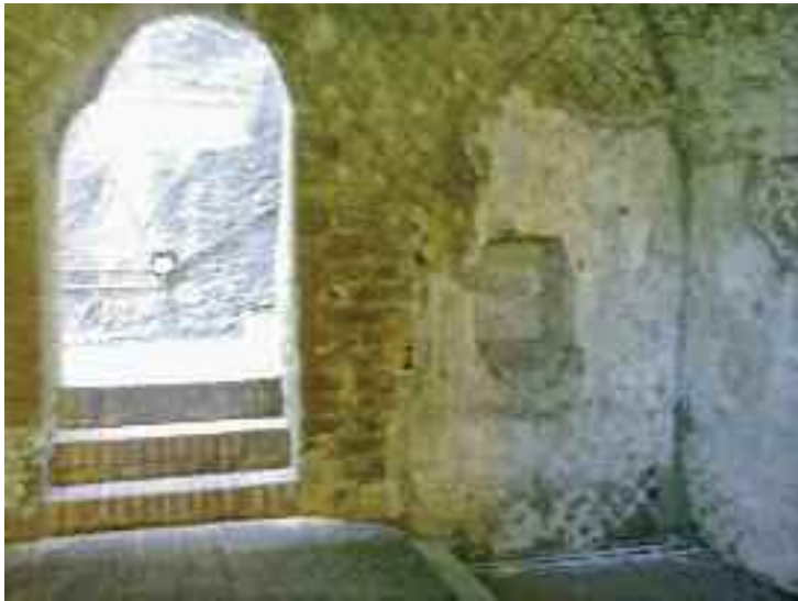
Fig. 4 - Interno