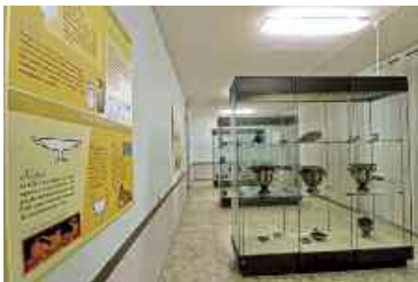
Fig. 4 - Una sala con tabelle esplicative

Un prezioso patrimonio storico e culturale che racconta dei Napoletani, della loro storia e delle radici da cui provengono. Una realtà che varrà la pena conoscere.