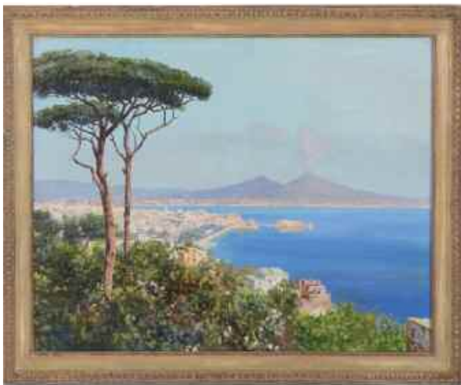
Fig. 6 – Veduta di Napoli con il pino

Fu abbattuto nel 1984, ormai vecchio e ammalato. Aveva resistito 129 anni, ritratto da pittori e fotografi fino a diventare il simbolo della città.