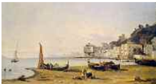
Fig. 31 - Sminck van Pitloo - Mergellina Sorrento, museo Correale