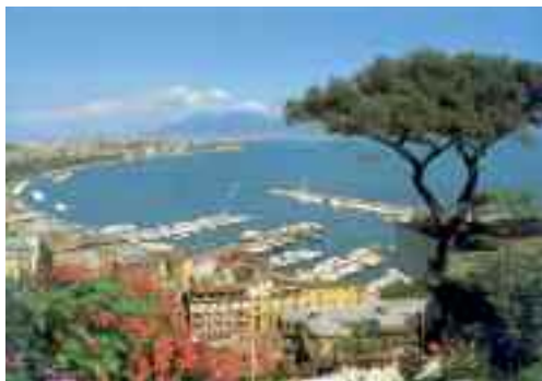
Fig. 1 - Panorama

Il pino di Napoli (fig. 1) era un albero, della specie Pinus pinea (pino domestico), che fino agli anni Ottanta adornava gran parte delle cartoline con la veduta panoramica della città di Napoli e del golfo partenopeo, con il Vesuvio a fare da sfondo, un'immagine che lo ha reso tuttora un simbolo ben noto dell'oleografia napoletana. Si trovava in prossimità