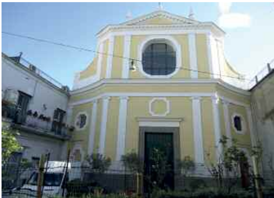
Fig. 1 - Napoli, chiesa di S. Maria della Consolazione a Villanova (facciata)

Nel casale di Villanova vi è la chiesa di Santa Maria della Consolazione (fig. 1) dalla spettacolare pianta esagonale, realizzata nel 1737 da Ferdinando Sanfelice, regno incontrastato per oltre cinquanta anni del leggendario parroco Giuseppe Capuano, morto in odore di santità.