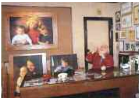
Fig. 1 - Jacques estroso fotografo

Le ricchezze archeologiche sono in gran parte sconosciute ai napoletani. Quanti di essi conoscono la misteriosa grotta di Seiano o hanno mai sentito parlare del grandioso teatro della Gaiola? Solo di recente la grotta restaurata è stata restituita ai napoletani che hanno cominciato a visitarla,