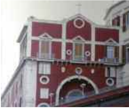
Fig. 3 - Chiesa di S. Maria del Parto

Tali cortesie erano frequenti tra le ragazze delle nobili famiglie, che spesso portavano dolcetti ai religiosi per farli distribuire ai poveri, per cui il vescovo non sospettò di nulla per il grazioso omaggio, ma mal gliene incolse, fu preso da una passione sfrenata verso Vittoria, il cui volto lo perseguitava giorno e notte e non poteva placare la sua frenesia se non attraverso quotidiani contatti ravvicinati del quarto tipo.