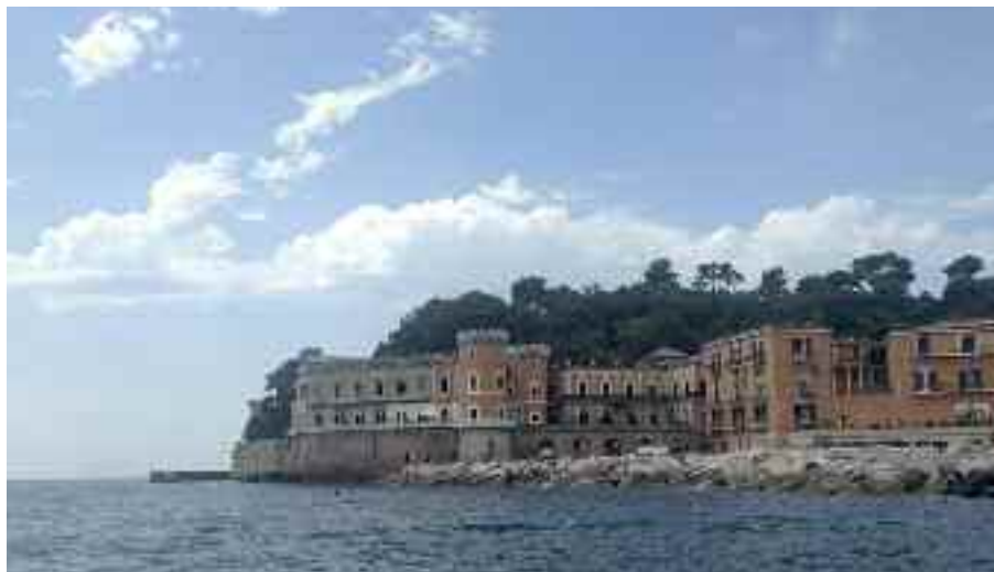
Fig. 24 -Villa Volpicelli

Villa Volpicelli (fig. 24), più famosa come villa Palladini, è da molti anni conosciuta perché il suo soleggiatissimo terrazzo ed il lussureggiante