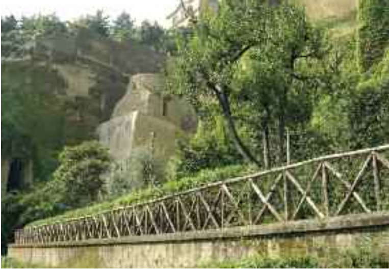
Fig. 1 - Ingresso

Tra i luoghi più dimenticati di Napoli, che viceversa potrebbero costituire un potente richiamo per i turisti, va annoverato al primo posto il parco Vergiliano, da non confondere con quello Virgiliano, fino a poco fa paradiso per le coppie in vena di effusioni erotiche.