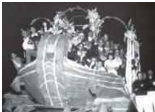
Fig. 5 - Luminarie alla villa comunale, Piedigrotta '54

La festa, a partire dal Novecento assunse perciò il carattere prevalente di una sagra canora ed era imperniata sulla sfilata dei carri allegorici, che erano mastodontici e venivano realizzati da valenti artigiani adoperando del cartone pressato. Durante i momenti più gioiosi della festa venivano utilizzati speciali giocattoli, atti ad incrementare ilarità ed impertinenza. essi erano le tante rumorose trombette, dai colori sgargianti e dal suono intermittente, lo zerrizzero, un ingegnoso aggeggio che, roteando su se stesso, emetteva un originale ronzio, il franfellicco, un fischietto dispettoso