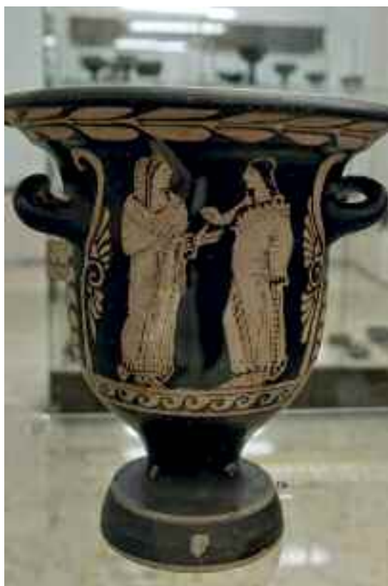
Fig. 7 - Ceramica a figure rosse

Ottocentoventicinque reperti, per gli amanti della precisione, che vanno dal 7° al 3°