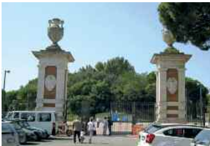
Fig. 1 – Ingresso Parco delle Rimembranze

Dall'epoca imperiale Posillipo è stata luogo di delizie ed ozio con ville spettacolari lungo la costa, da quella del divino Augusto a tante altre di rango. La tradizione è continuata durante il periodo aragonese e vicereale, per accentuarsi dopo l'apertura nel 1812 di via Posillipo e negli anni Trenta del secolo scorso di via Petrarca, via Orazio e via Manzoni, dove ambivano dimorare professionisti ed imprenditori. Al fianco di questi insigni personaggi coabitavano pacificamente pescatori e contadini.