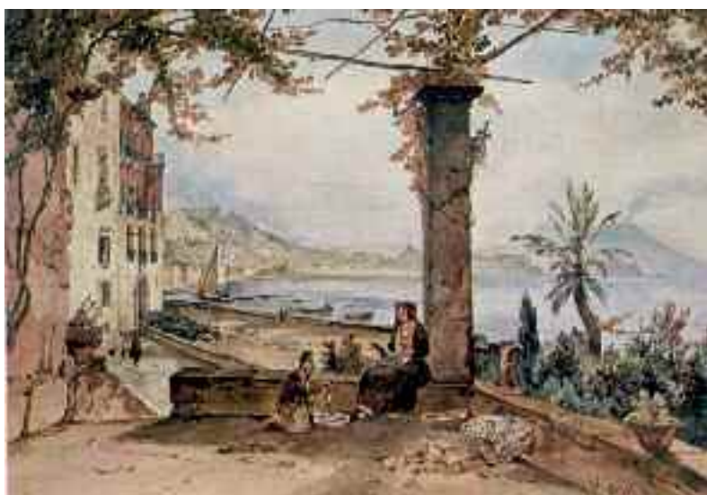
Fig. 9 - Achille Vianelli - Posillipo - Italia, collezione privata