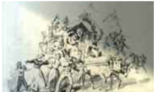
Fig. 3 - Verso il santuario di Piedigrotta, Stampa ottocentesca

La Piedigrotta, dopo aver assunto un carattere religioso, divenne una manifestazione prevalentemente notturna con grande partecipazione popolare. Appena usciti dalla chiesa, la grotta limitrofa e tutte le aree circostanti si trasformavano in una gigantesca sala da ballo nella quale si danzava al suono di arpe e cimbali, prevalentemente la tarantella il ballo tipico partenopeo, derivante anche esso dalle antiche danze che accompagnavano i baccanali, più o meno orgiastici, di epoca pagana. Lentamente la festa cominciò ad estendersi a tutta la città coinvolgendo nobili e popolani, tra uno sflogorio di luminarie, carri e canzoni. Molti affittavano i balconi dai quali si poteva meglio ammirare il passaggio dei carri, carichi di fiori e costruzioni di cartapesta, con i vari quartieri in gara tra di loro per creatività e magnificenza. Nacque anche l'usanza di presentare durante quei giorni di baldoria un repertorio di nuove canzoni napoletane, da cui nacque il celebre festival ed