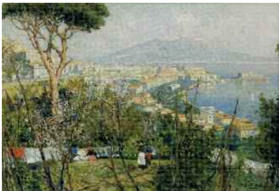
Fig. 15 - Attilio Pratella - Panni stesi a Posillipo con vista del Vesuvio Italia, collezione privata