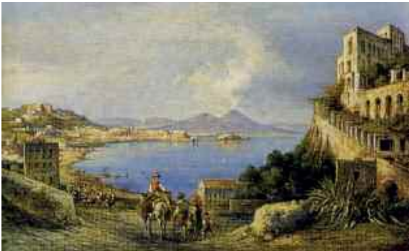
Fig. 7 - Consalvo Carelli - Napoli da Posillipo - Napoli, collezione privata

Un altro scorcio di panorama (fig. 9) molto bello ce lo regala Achille Vianelli in una tela firmata.