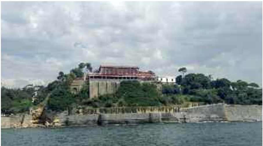
Fig. 20 - Villa Barracco

Nella cornice di questa splendida villa nasce come evento mondano Na-