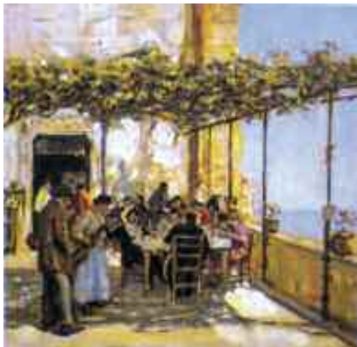
Fig. 3 - Migliaro, Trattoria a Posillipo

Intrisa di umori sanguigni, che dall'antica Grecia arrivavano alla focosa Spagna, l'atmosfera delle taverne è stata immortalata in numerosi libri e lavori teatrali di stupefacente attualità, ma per chi volesse rivivere quei luoghi leggendari consigliamo di leggere Salvatore Di Giacomo, il quale sulle pagine di Napoli Nobilissima, nel 1899, parlò in una serie di articoli delle più famose taverne napoletane. Tali scritti furono illustrati da acquerelli e disegni di Gonsalvo Carelli ed infine furono stampati in un estratto di 62 pagine dall'editore Vecchi di Trani. In questo opuscolo, oramai una rarità bibliografica, si parla di locali leggendari, tutti