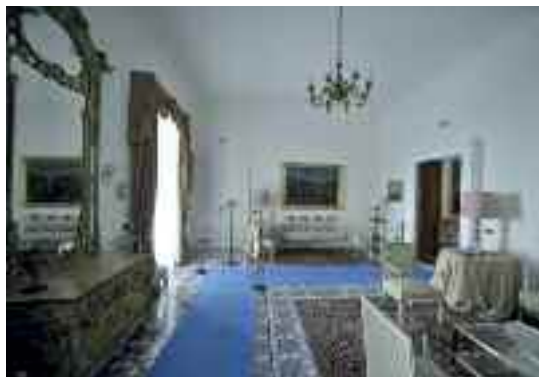
Fig. 23 - Villa Rosebery (interno)