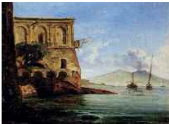
Fig. 20 - Sminck van Pitloo - Palazzo Donn'Anna - Napoli, collezione privata

Vediamo poi all'opera due Salvatore, il primo famoso: Fergola, che si esibisce in una Veduta della collina di Posillipo da Coroglio (fig. 10), esposta nel museo di Capodimonte; il secondo sconosciuto: Gentile, che fa quel che può (fig. 11).