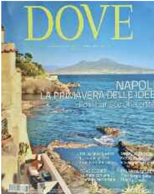
Fig. 6 - Villa Capasso

personaggi famosi e con il suo entusiasmo elettrizzava il pubblico.