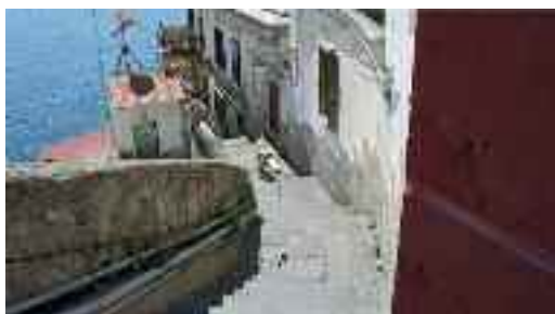
Fig. 33 -Discesa San Pietro ai due frati

Più avanti, di colore rosso, ecco Villa Pavoncelli (fig. 36), nata dall'ex casino del duca di Frisia, e convertita nel 1840 nella famosa trattoria dello Scoglio di Frisio (fig. 37), ritorna residenza signorile a fine secolo, quando fu acquistata dai conti Pavoncelli ed è oggi un anonimo condominio.