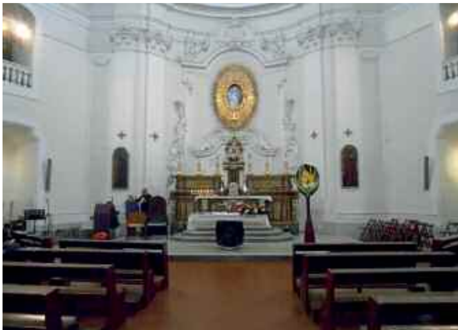
Fig. 2 - Napoli, chiesa di S. Maria della Consolazione a Villanova (Interno)

L'interno (fig. 2) è allegro, molto luminoso e sembra sollecitare una preghiera di ringraziamento più che una supplica. Ha una storia alle spalle, ma soprattutto un segreto da svelare.