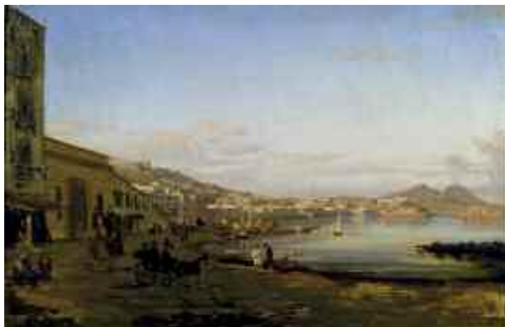
Fig. 24 - Giacinto Gigante - Marina di Posillipo - Napoli, collezione privata