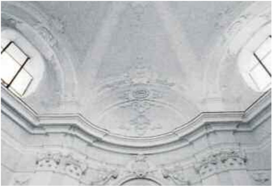
Fig. 3 - Napoli, chiesa di S. Maria della Consolazione a Villanova (stucchi della volta)

Il risultato entusiasmò il De Dominicis il quale affermò: "che prospetto così vago e accordato, più bello non si può desiderare". Infatti il Sanfelice adottò una soluzione rivoluzionaria per quell'epoca, collocando su sei pilastri, nell'interno esagonale con tre finestroni, un'unica struttura di copertura con tre capriate in legno, una finta volta incannucciata e tegole.