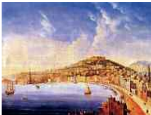
Fig. 3 - Teodore Duclere - Veduta di Napoli Napoli collezione della Ragione

Eppure Napoli è stata sempre l'unica città che ha visto convivere, fianco a fianco, nello stesso quartiere e nello stesso palazzo, ricco e povero, signore e plebeo e questa vicinanza urbanistica avrebbe potuto costituire un propellente capace di sprigionare quella carica di energia vitale necessaria al cambiamento. Ma ciò è avvenuto unicamente nella musica, nel teatro e nell'arte, mai nell'economia e nel sociale e per questo che Napoli ed i napoletani continuano a vivere costretti in un opprimente presente senza saper ipotizzare un decente futuro.