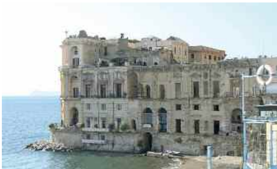
Fig. 40 - Palazzo Donn'Anna