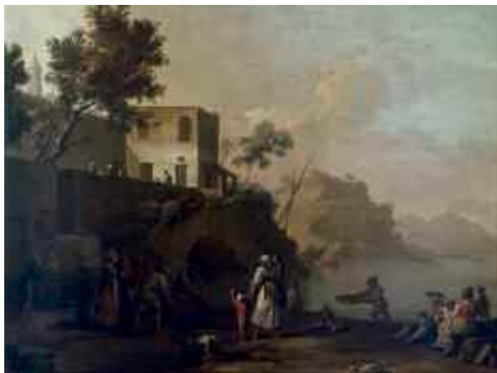
Fig. 19 - Pietro Fabris - Popolani a Posillipo - Napoli, museo di San Martino