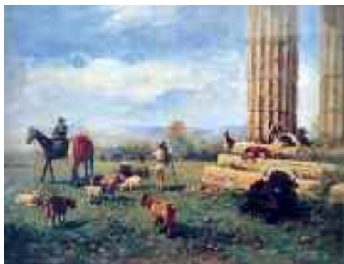
Fig. 2 - Nicola Palizzi - Veduta di Paestum Napoli collezione della Ragione

Con la caduta dei Borbone e l'annessione al nuovo regno monopolizzato dai Savoia, la città si trovò a dovere interpretare un ruolo di provincia e la