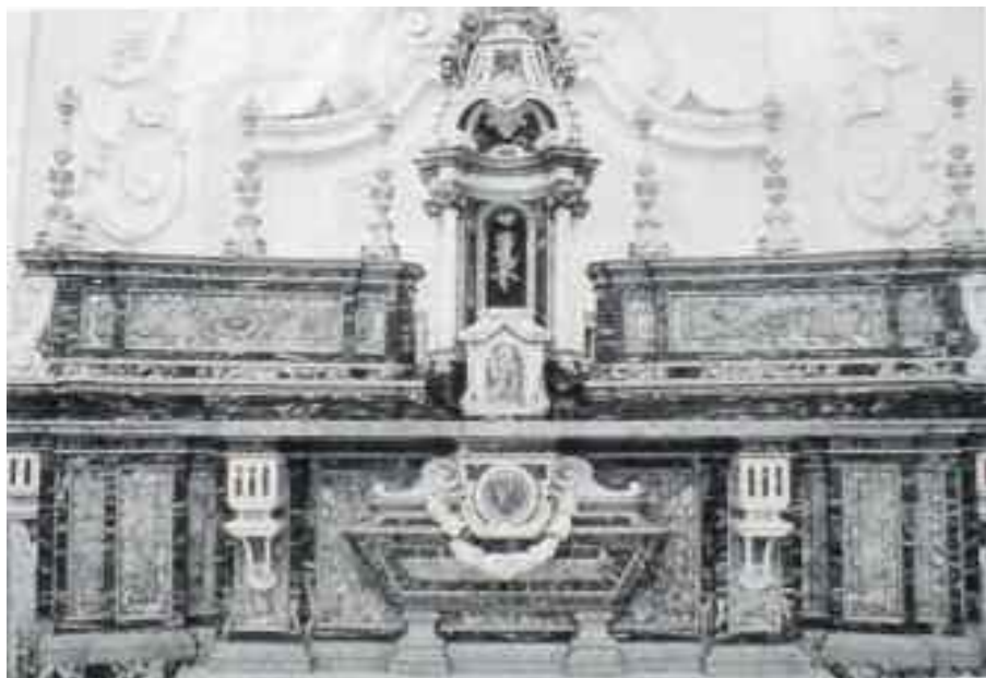
Fig. 4 -Napoli, chiesa di S. Maria della Consolazione a Villanova (Altare)

Borromini. Si può osservare un alternarsi di pareti piane e di pareti curve che sottolinea il dinamismo plastico accentuato dalla presenza della doppia parasta, in modo che l'ordine architettonico accompagni il disegno planimetrico delle pareti: anche la trabeazione, allora, si incurva per accogliere la calotta che completa la piccola abside. Ampi finestroni inondano di luce l'ambiente illuminando i delicati stucchi (fig. 3), di alta qualità e di gusto rococò, che decorano la bella volta esagonale, il cui disegno geometrico è accentuato dai bianchi costoloni che si affiancano sulle vele grigie.