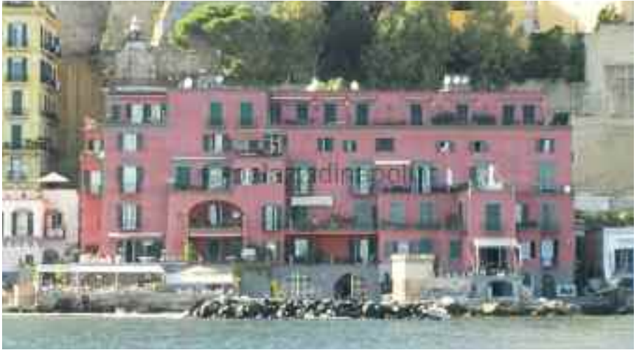
Fig. 43 - Villa Quercia