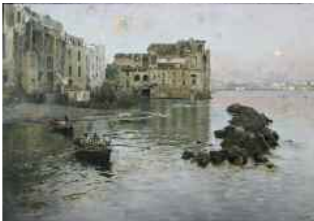
Fig. 22 - Gaetano Esposito - Palazzo Donn'Anna a Posillipo Napoli collezione privata

(fig. 14), esposto nel museo di San Martino, Attilio Pratella con Panni stesi a Posillipo con vista del Vesuvio (fig. 15) di una raccolta privata, Alessandro D'Anna con Locanda a Posillipo (fig. 16) conservato a Roma in collezione privata.