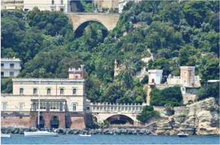
Fig. 27 - Villa Peirce

celebre scienziato Eduardo Caianiello, massimo esperto di cibernetica ed in egual misura di fuochi artificiali, che sparò in quantità industriale dalla spettacolare balconata a picco sul mare del suo appartamento.