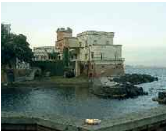
Fig. 26 - Villa Peirce, porticciolo e spiaggetta