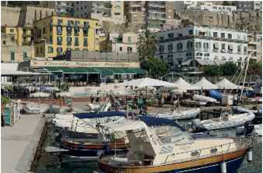
Fig. 44- Circolo Nautico Posillipo