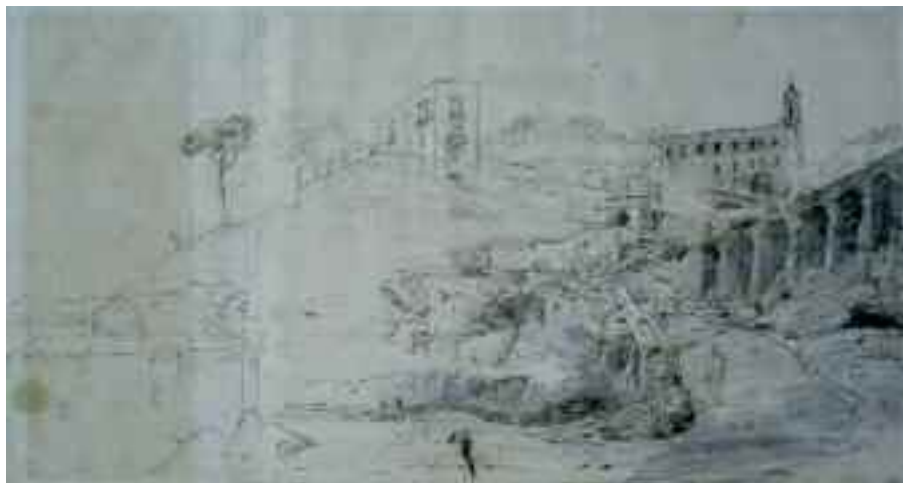
Fig. 14 - Gaspar Van Wittel - Sant'Antonio a Posillipo Napoli, museo di San Martino