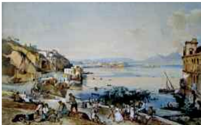
Fig. 23 - Giacinto Gigante - Veduta di Napoli da Posillipo Napoli, museo di Capodimonte

(fig. 14), esposto nel museo di San Martino, Attilio Pratella con Panni stesi a Posillipo con vista del Vesuvio (fig. 15) di una raccolta privata, Alessandro D'Anna con Locanda a Posillipo (fig. 16) conservato a Roma in collezione privata.