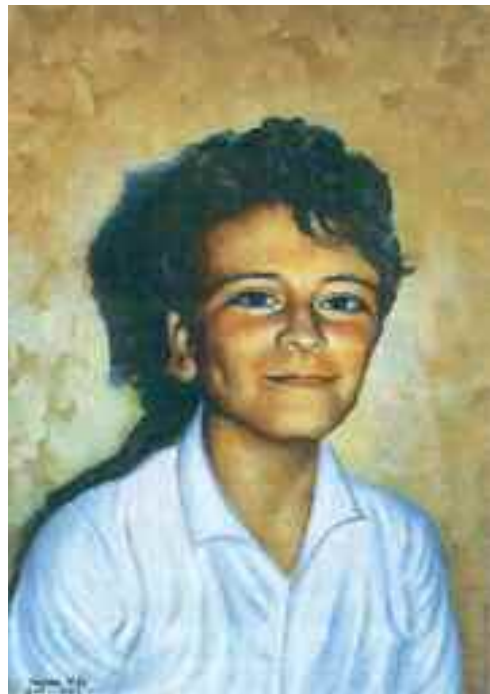
Fig. 4 - Sorriso malizioso

Valenzi ha dedicato molte delle sue energie alla grafica ed i suoi disegni possiamo trovarli a prezzi abbordabili presso l'Ariete, galleria nata da trenta anni e famosissima per le sue