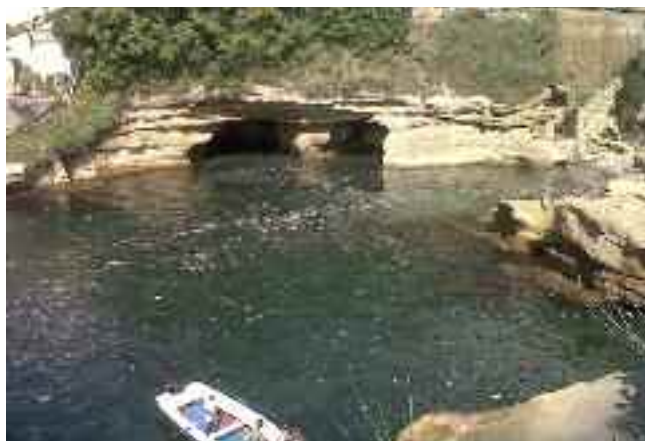
Fig. 14 -Monnezza a mare

Nell' ex ospizio di Villa Marino, un tempo Bagno dei Preti, il principe di Piemonte Umberto si tuffava qui, tra Riva Fiorita (fig. 13) e Villa Volpicelli, insieme ai "guaglioni" E nelle 5 grotte aperte sul mare si costruivano apparecchi da bombardamenti di giorno e di sera, sopra la piattaforma, si ballava al suono del mare. A vederla quella piattaforma, sembra una base abbandonata. Come le cabine. Il mare una cloaca (fig. 14).