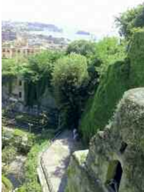
Fig. 2 - Panorama