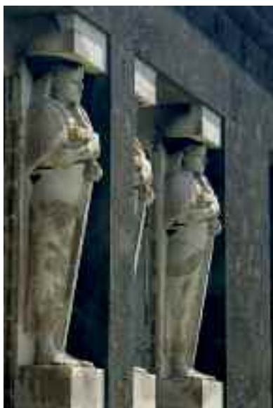
Fig. 4 - Cariatidi