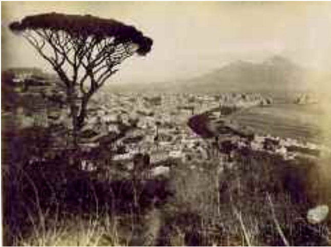
Fig. 3 - Il pino di Posillipo

È stato per anni l'albero più famoso al mondo, quello più fotografato (fig. 3-4) e ritratto nei dipinti di artisti più o meno illustri (fig. 5-6). È il pino