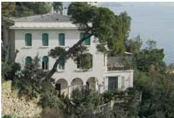
Fig. 28 - Villad'Avalos

Per molti anni vi sono stati gli studi di Canale 21, la più importante emittente privata campana, alle cui trasmissioni ho spesso partecipato come ospite.