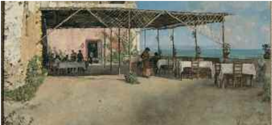
Fig. 17 - Vincenzo Migliaro - Taverna a Posillipo Napoli, Galleria di Palazzo Zevallos di Stigliano