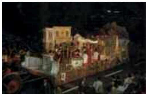
Fig. 8 - Carro vincitore Piedigrotta '64

degli anni Cinquanta e Sessanta, i giovani non conoscono la Piedigrotta, ma il suo spirito è immortale e può divampare di nuovo per la gioia dei napoletani e per il nostro boccheggiante turismo. Ai tempi del vituperato Comandante il calendario delle manifestazioni, ad uso dei forestieri, ma progettato per i gusti degli indigeni, andava da aprile ad ottobre, costringendo pure i rinomati miracoli di San Gennaro a rientrare nei festeggiamenti e riesumando inoltre antiche tradizioni, da quella del Monacone a quella della Madonna del Carmine, col relativo incendio della torre.