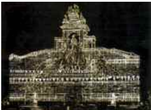
Fig. 4 - Un carro a Piedigrotta durante il regno di Lauro

che, srotolandosi di scatto e ripiegandosi velocemente all'indietro, veniva adoperato per sfiorare il viso dei vicini, spaventandoli per la sorpresa. Vi erano poi tanti strumenti musicali tradizionali, che collaboravano a creare confusione ed allegria: il putipù, una casseruola ricoperta di pelle forata al centro, dalla quale si generava un suono che richiamava quello sfottente e caricaturale delle per-