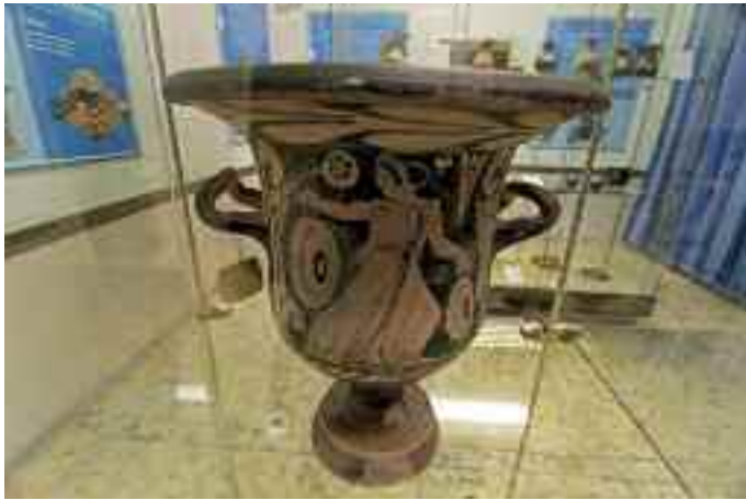
Fig. 8 - Ceramica a figure rosse

secolo avanti Cristo. Di questi, 250 sono stati ritrovati nella zona di Orvieto e sono proprio d'epoca etrusca. Altri 47, invece, sono reperti di origine sannitica provenienti dalla zona di Montesarchio. Questi ultimi sono passati per mani di proprietari illustri come la reale famiglia D'Avalos d'Aragona. Coppe e brocche con pregiati mascheroni decorativi con cinghiali e cavalli alati nei tipici colori nero lucente.