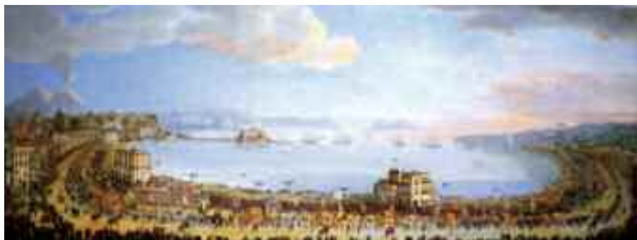
Fig. 1 - Antonioni Pietro, Il corteo reale a Piedigrotta, Roma collezione privata

Altri fattori culturali molto variegati di origine etrusca, greca ed orientale sono presenti nella Piedigrotta, a dimostrazione della variegata complessità del senso religioso del napoletano.