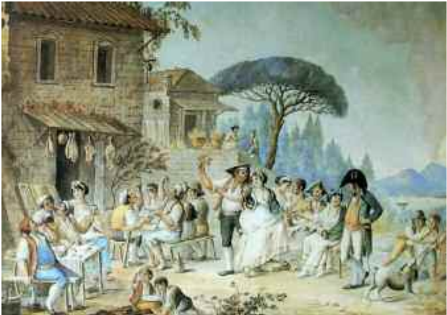
Fig. 16 - Alessandro D'Anna - Locanda a Posillipo - Roma, collezione privata