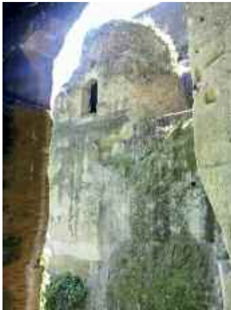
Fig. 5 – Tomba Virgilio