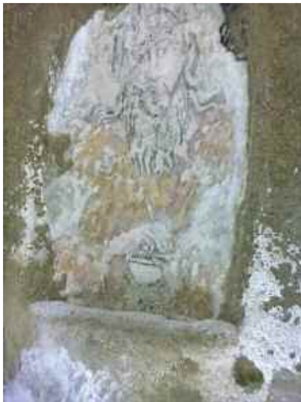
Fig. 6 – Culto del dio Mitra

Si sale lentamente lungo un viale alberato ed i rumori scompaiono, anche i treni diventano una lontana presenza. Dopo la seconda curva com-