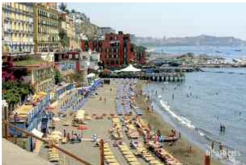
Fig. 16 - Bagno Elena

«aperti» si contano. Sopravvive il più antico, Bagno Elen (fig. 15-16), 160 anni di storia e un lenzuolo di sabbia per godere (nel caos) la vista sul Golfo. Villa Imperiale, splendido scrigno con piscine di acqua salata protetto dalla Villa degli Spiriti di Pollione ospitò Giulio Cesare e Tiberio: oggi è il lido più ambito di Napoli, forse perché frequentato dal sottoscritto.