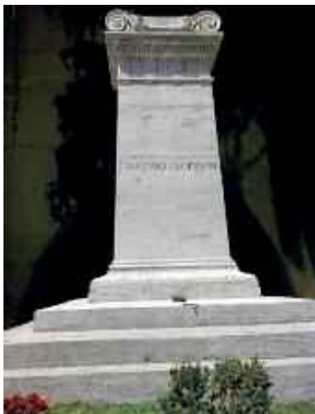
Fig. 8 – Tomba Leopardi