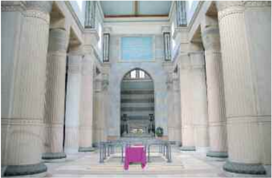
Fig. 2 - Primo piano

Fin qui abbiamo riportato il testo di una lettera che abbiamo inviato ai giornali napoletani con la speranza di smuovere le torbide acque della bu-