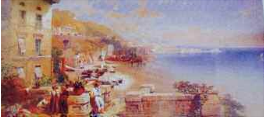
Fig. 4 - Thomas Miles Richardson - Costiera di Posillipo Napoli collezione della Ragione