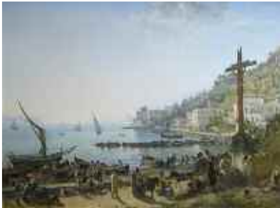
Fig. 28 - Gaspar Van Wittel - Veduta del borgo di Chiaia verso Mergellina - Firenze, Galleria Palatina

Gaspar Van Wittel ci regala una Veduta del borgo di Chiaia verso Mergellina (fig. 28) conservata a Firenze nella Galleria Palatina, mentre Silvestr Feodosievic Scedrin si esibisce in una Veduta di Mergellina (fig. 29).