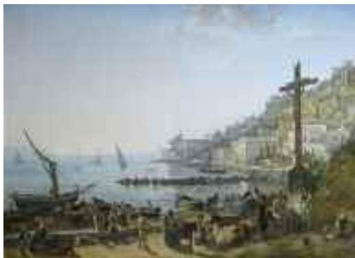
Fig. 29 - Silvestr Feodosievic Scedrin Veduta di Mergellina - Italia, collezione privata