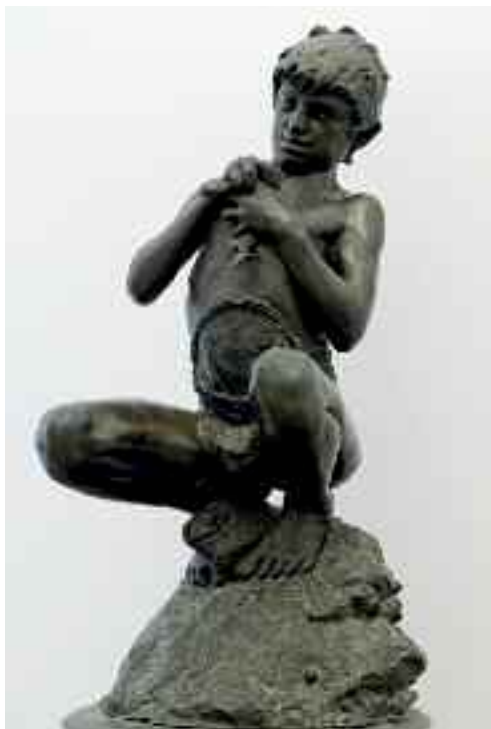
Fig. 35 - Pescatorello di Vincenzo Gemito

Di colore giallo partenopeo si riconosce poi l'Ospizio Marino Padre Ludovico da Casoria (fig. 38), una delle strutture storico religiose più interessanti della città, infatti nel 2007 è stata oggetto di una visita guidata dal sottoscritto, presidente della benemerita associazione Amici delle chiese napoletane.