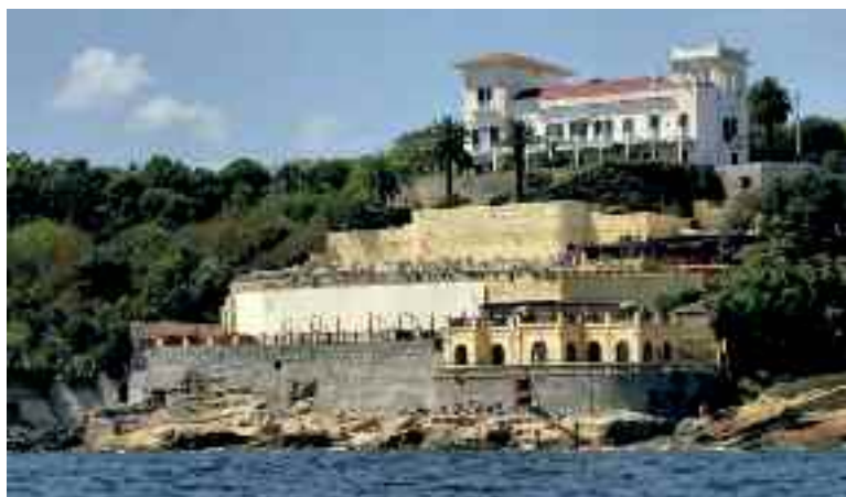
Fig. 8 - Villa Fattorusso

Basta percorrere pochi metri e c'imbattiamo in villa Fattorusso, nota al pubblico per essere divenuta da alcuni decenni il più costoso stabilimento balneare di Posillipo: Le Rocce verdi (fig. 8), dotato di un ampio parcheggio, di una spettacolare piscina e di una affascinante discesa a mare tra an-