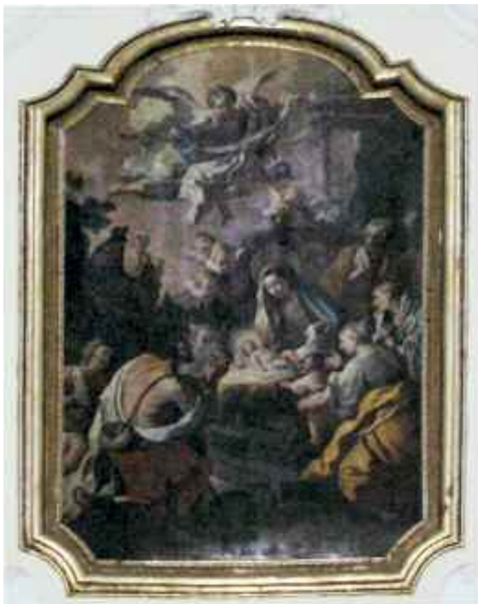
Fig. 7 - Paolo di Majo - Natività Napoli chiesa di S. Maria della Consolazione a Villanova

Del 1639 sono due pannelli ad olio conservati ai lati dell'altare, entrambi siglati ed uno datato. A grandezza naturale rappresentano Sant'Agostino (fig. 8) e San Giovanni Battista (fig. 9). Di mediocre qualità, mostrano l'artista suggestionato dalle coeve esperienze di ambito iberico, soprattutto il Battista ricorda in qualche aspetto le affilate impostazioni disegnative di Zurbaran. Influsso della cultura spagnola che ritroveremo ancora in alcune delle tele del Marullo, come nella Pesca miracolosa, nella quale è tangibile lo stile del Greco nella definizione delle figure allungate e spigolose.