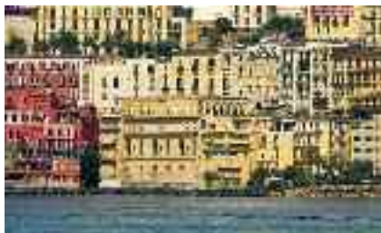
Fig. 38 - Ospizio marino

della città partenopea, a lungo sede della Fondazione culturale Ezio De Felice, normalmente chiuso, ma di recente da me visitato in occasione della presentazione di un libro di Silvio Perrella.