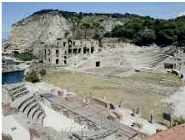
Fig. 2 - Teatro romano

Con grande meraviglia ci recammo in un'area contigua alla sua villa dove potemmo ammirare, ben conservato, uno splendido teatro in grado di contenere 2.000 spettatori (fig. 2), un Odeion e altre strutture di sommo interesse archeologico, da un ninfeo a delle antiche terme.