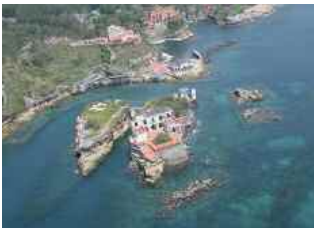
Fig. 4 - Isolotto della Gaiola dal cielo

d'assalto, entrambi fummo coinvolti in una penosa disavventura fiscale, dalla quale ho impiegato anni e anni per uscire indenne.