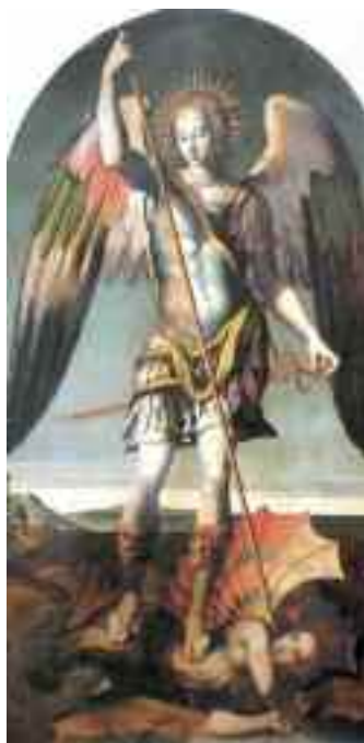
Fig. 1 - Leonardo da Pistoia - San Michele abbatte Satana

Le cronache ci riferiscono solo il nome di battesimo, Vittoria, ma noi sappiamo che si trattava di una D'Avalos, per qualche anno novizia nel famigerato convento di S. Arcangelo a Baiano, la quale, invaghitasi del vescovo di Ariano Diomede Carafa, abbandonò la tristezza del claustro ed incaricò una celebre fattucchiera del tempo di preparare una pozione per far innamorare di lei il religioso.