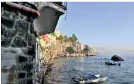
Fig. 34 - San Pietro ai due frati

Poco dopo incontriamo la villa Roccaromana (fig. 32) con la sua pagoda di stile orientale e la gigantesca caverna abitata da pallidi fantasmi ed intravediamo la zona di San Pietro ai due frati sulla quale fioriscono numerose leggende.