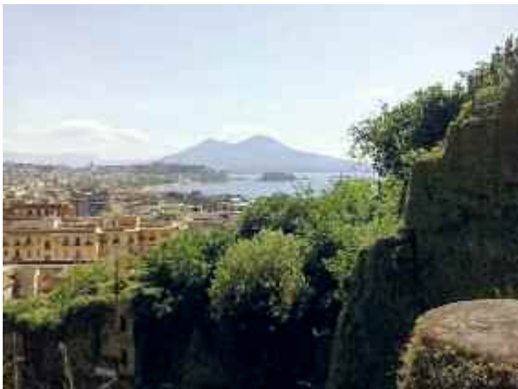
Fig. 9 – Vesuvio

Se ci inerpiamo ancora arriviamo all'ingresso della Cripta napoletana, la famigerata grotta dove per secoli si sono celebrati riti dionisiaci, per non dire orgiastici, dove è nata la sfogliatella e la festa di Piedigrotta. Una galleria che, secondo la leggenda di Virgilio non solo poeta, ma anche mago, fu da lui costruita in una sola notte, con l'auto di duemila diavoli.