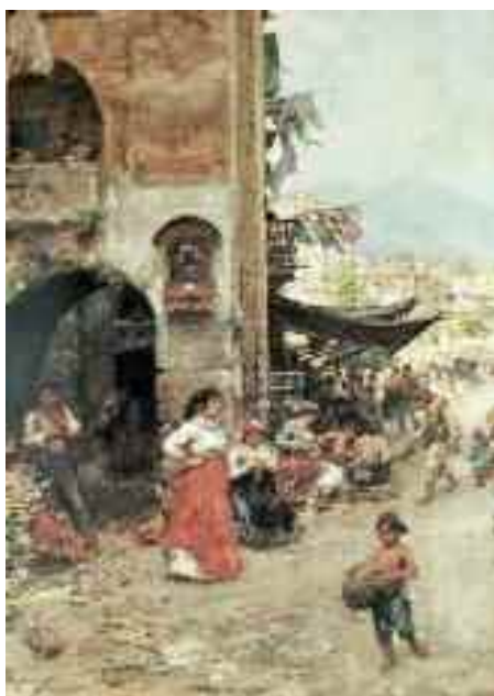
Fig. 25 - Vincenzo Migliaro A Mergellina - Napoli, collezione privata

A Posillipo vi erano numerose taverne, alcune famose, come lo Scoglio di Frisio, rappresentato fedelmente da Vincenzo Migliaro (fig. 17) in un dipinto esposto nelle Gallerie di Palazzo Zevallos di Stigliano.