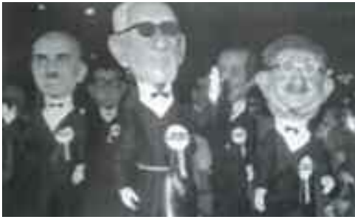
Fig. 2 - Sfilata di fantocci a Piedigrotta

far scaricare, anche se solo per pochi giorni, l'energia vitale della popolazione che si sarebbe poi dimostrata sottomessa per il restante periodo dell'anno.