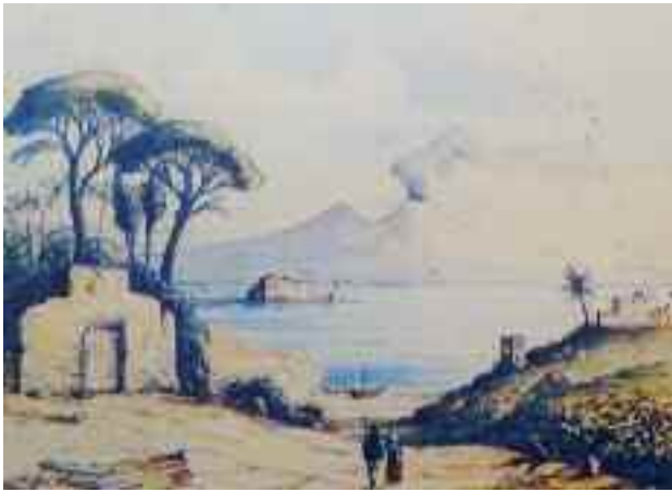
Fig. 6 - Giuseppe Carelli - Scorcio di paesaggio - Napoli collezione della Ragione

Un artista straniero, Carl Goetzloff, è poi l'autore di un'altra Veduta di Napoli da Posillipo (fig. 8) in cui risaltano i pini mediterranei.