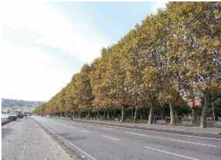
Fig. 2 - Via Caracciolo

Fino alla fine dell'800, il mare giungeva quasi fino ai palazzi della Riviera di Chiaia; poi si decise di colmare la spiaggia, creando questa nuova strada, dedicata all'ammiraglio napoletano del Settecento, uno dei personaggi della Rivoluzione del 1799. Le scogliere presero così il posto della