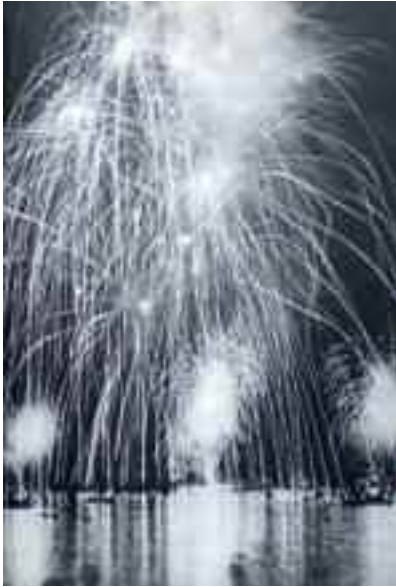
Fig. 6 - Fuochi a mare a Piedigrotta

L'antico splendore della manifestazione era incentrata sul passaggio per le vie cittadine dei mastodontici carri allegorici, quando era permesso un po' di tutto: urlare, sbracciarsi, calare coppoloni in testa a tipi soggetti, esercitare vigorosamente la mano morta su sederi di tutte le età, pur senza trascurare eventuali seni generosamente esposti, dimenticando così le angustie quotidiane. L'antico spirito greco della festa, nata tra venerazioni priapiche e sfrenate danze liberatorie, sembrava rivivere nel popolo festoso, esaltando lo spirito trasgressivo e godereccio dei napoletani.