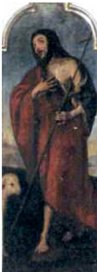
Fig. 9 - Giuseppe Marullo S. Giovanni Battista - siglato Napoli chiesa di S. Maria della Consolazione a Villanova

Dopo la storia e la descrizione dei dipinti passiamo a rivelare il segreto che nasconde la chiesa e che venne scoperto in occasione del terremoto del 1980, quando una parte del pavimento crollò, mettendo in mostra antiche mura, così descritte in una relazione che abbiamo reperito tra polverose carte nell'archivio della Soprintendenza: "parte di una pavimentazione in cotto maiolicato e in marmo di età quattrocentesca, resti di murazione