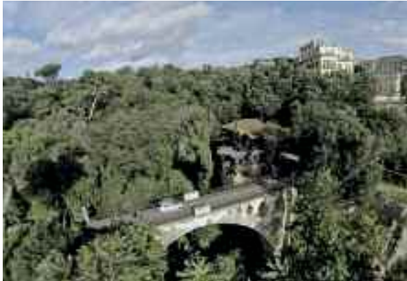
Fig. 19 - Villa Lucia

isolata dalla città da un immenso parco di pini, oleandri, gigantesche piante di ibiscus in fiore e delicati esemplari di peonie rosse dal profumo tenue ed indimenticabile.