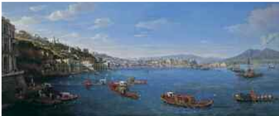
Fig. 21 - Gaspare van Wittel - Posillipo con Palazzo Donn'Anna Napoli collezione privata

Ammiriamo ora Teodoro Duclère nella Baia di San Pietro a Posillipo (fig. 12) conservata a Napoli, nella pinacoteca della provincia; Frans Verploet che ritrae La strada di Posillipo e Villa Doria d'Angri (fig. 13), Gaspar Van Wittel in un disegno raffigurante la chiesa di Sant'Antonio a Posillipo