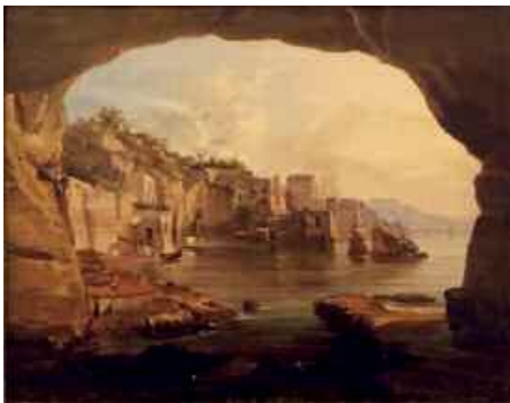
Fig. 12 - Teodoro Duclère - La baia di San Pietro a Posillipo Napoli, pinacoteca della provincia