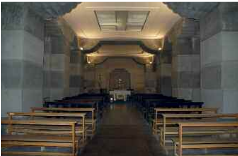
Fig. 3 - Chiesa interna