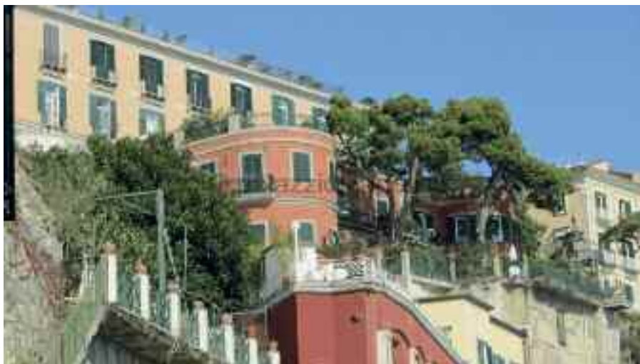
Fig. 30 - Villa Cottrau

prediletta. In cambio mi presentò alcune nobildonne di gentile aspetto e di facili costumi con le quali trascorsi ore liete e produttive, stando però attento a non riprodurmi.