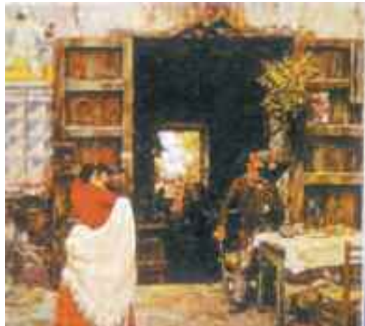
Fig. 5 - Migliaro, Una taverna napoletana

Nel 1910 un nuovo cambio di proprietà a seguito di una storia d'amore tra una figlia dell'editore milanese Bietti ed uno dei Musella, poi di nuovo, nel 1914, assunse le redini dello Scoglio di Fri-