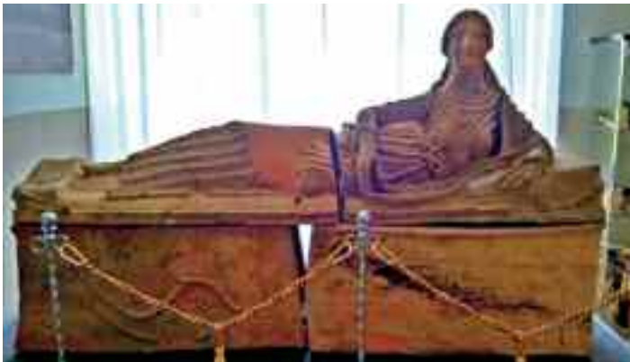
Fig. 3 - Sarcofago con figura muliebre

L'insediamento etrusco Caudium rappresenta, infatti, una delle più importanti testimonianze degli Etruschi in Campania. Una realtà che coinvolge una vasta area, a partire dalle zone di Montesarchio fino alle terre dell'Agro Picentino dove sorgono Nola, Nocera, Ercolano, Pompei e tante altre importanti città tra le quali Capua, che risulta essere una dei principali capoluoghi etruschi del territorio.