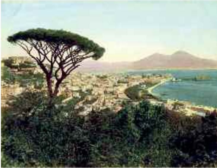
Fig. 4 - Il pino di Posillipo in una foto