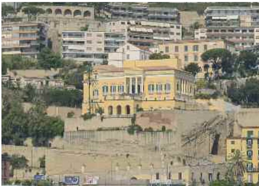
Fig. 45 - Villa Doria d'Angri (vista dal mare)

A Napoli la nascita del primo circolo risale al 7 maggio del 1778, negli anni successivi i circoli sorgeranno a Napoli come funghi, per ultimo nel 1925, il Giovinezza, che nel dopoguerra, rammentando un'imbarazzante