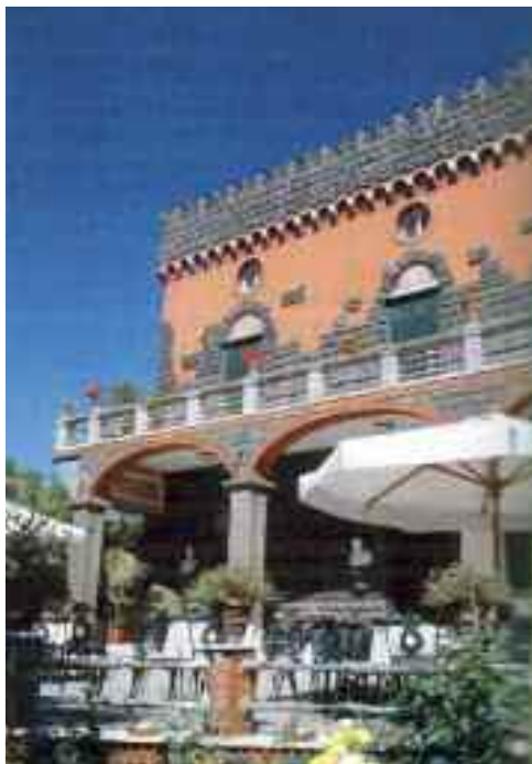
Fig. 5 - Torre Ranieri

Alle spalle della villa un'enorme tenuta in cui i proprietari, dopo una lunga scelta tra selezionati vitigni, hanno creato il vino doc don Filippo, che dalla prossima vendemmia sarà il giusto corollario della mensa di pochi fortunati. Le sale del castello, viceversa, non sono frequentate da po-