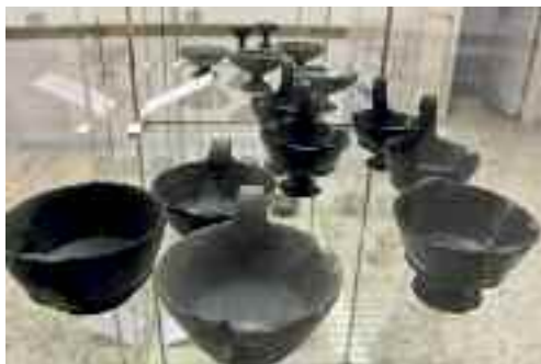
Fig. 6 - Reperti antichi

Vivevano di un'arte propria, senza alcun influsso esterno, e prima dell'arrivo dell'imperialismo romano – la presa di Veio avviene nel 396 a.C. – ci hanno lasciato ceramiche, urne funerarie, pitture, tombe e altre testimonianze della loro cultura.