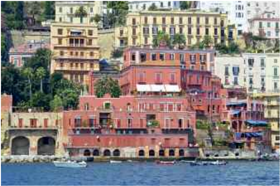
Fig. 36 - Villa Pavoncelli

mán, duca di Medina de las Torres. Il progetto per la realizzazione fu commissionato al più importante architetto della città di quel periodo, Cosimo Fanzago, che nel 1642 approntò un disegno secondo i canoni del barocco napoletano, che prevedesse tra le altre cose anche la realizzazione di un doppio punto d'ingresso, uno sul mare ed uno da una via carrozzabile che si estendeva lungo la costa di Posilipo (che conduce al cortile interno dell'edificio). Per la costruzione del palazzo, fu necessario demolire una preesistente abitazione cinquecentesca. Il Fanzago, però, non riuscì a completare l'opera per via della prematura morte di donn'Anna, avvenuta in un contesto di insorgenza popolare a causa della temporanea caduta del vicereame spagnolo, con