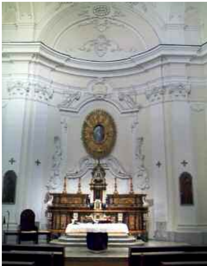
Fig. 5 - Napoli, chiesa di S. Maria della Consolazione a Villanova (tavola cinquecentesca)

vabo conservato in sacrestia, ricomposti nell'attuale contesto nel 1575, ma risalenti ai primi anni di quel secolo.