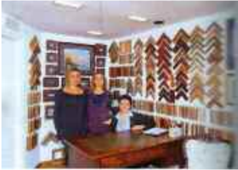
Fig. 3 - Le tre Grazie

cornici, di ogni stile, formato e prezzo, frutto di un artigianato apprezzato e richiestissimo.