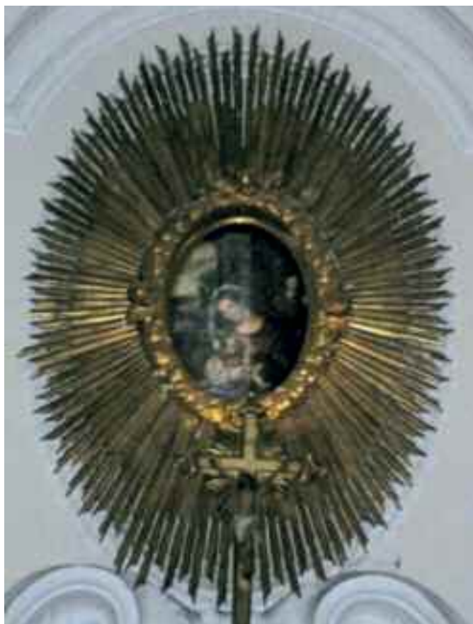
Fig. 6 -Napoli chiesa di S. Maria della Consolazione a Villanova (tavola cinquecentesca)

la bottega del Solimena, quando questi era intento ad approfondire la sua esperienza in senso classicista. Essi sono la testimonianza della predilezione del Di Majo per formule geometrizzanti e la ripresa di elementi culturali neocinquecenteschi, in opposizione alle contemporanee proposte di Domenico Antonio Vaccaro. L'adesione del pittore alle direttive ecclesiastiche, volte a depurare le immagini sacre da ogni pur minimo carattere di laicità e interessate alla diffusione del culto mariano, si manifesta pienamente nei due dipinti in esame.