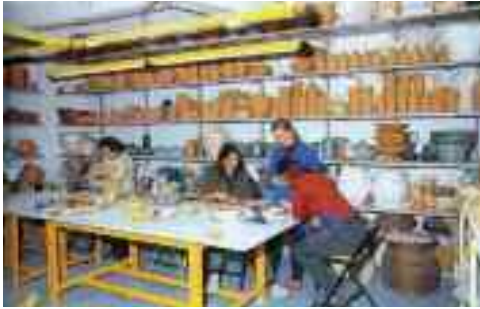
Fig. 6 - Laboratorio di ceramica

chi eletti, bensì grazie ad un'illuminata scelta imprenditoriale dei De Vita, almeno per un giorno, in occasione di feste e sponsali, diventano il sogno proibito per tante persone di tutte le età.