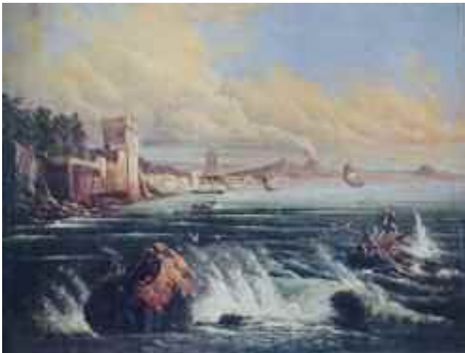
Fig. 5 - Consalvo Carelli - Veduta di Napoli da Posillipo Napoli collezione della Ragione

Sempre di Consalvo proponiamo poi al lettore un Panorama di Napoli col Vesuvio (fig. 7) di notevole qualità.