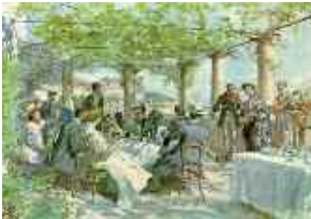
Fig. 37 - Trattoria Lo scoglio di Frisio

mán, duca di Medina de las Torres. Il progetto per la realizzazione fu commissionato al più importante architetto della città di quel periodo, Cosimo Fanzago, che nel 1642 approntò un disegno secondo i canoni del barocco napoletano, che prevedesse tra le altre cose anche la realizzazione di un doppio punto d'ingresso, uno sul mare ed uno da una via carrozzabile che si estendeva lungo la costa di Posilipo (che conduce al cortile interno dell'edificio). Per la costruzione del palazzo, fu necessario demolire una preesistente abitazione cinquecentesca. Il Fanzago, però, non riuscì a completare l'opera per via della prematura morte di donn'Anna, avvenuta in un contesto di insorgenza popolare a causa della temporanea caduta del vicereame spagnolo, con