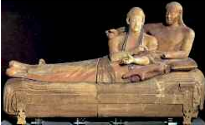
Fig. 2 - Sarcofago con 2 figure

Una straordinaria occasione per conoscere le tracce di un ampio dominio, arrivato fino in Campania.