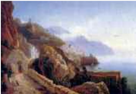
Fig. 1 - Pitloo - Veduta di Amalfi Napoli collezione della Ragione

Nei primi decenni dell'Ottocento la capitale borbonica esercitava una duplice attrazione sugli intellettuali e sugli artisti grazie al fascino dell'incomparabile bellezza del suo golfo ed al fascino di un'antica civiltà riportata alla luce di recente con eccezionale abbondanza di reperti. Ed a riempire di umanità quello spettacolare scenario naturale e quel vetusto emporio di arte, che continuava sorprendentemente a svelarsi giorno dopo giorno, vi era la solare esuberanza dello spirito partenopeo.