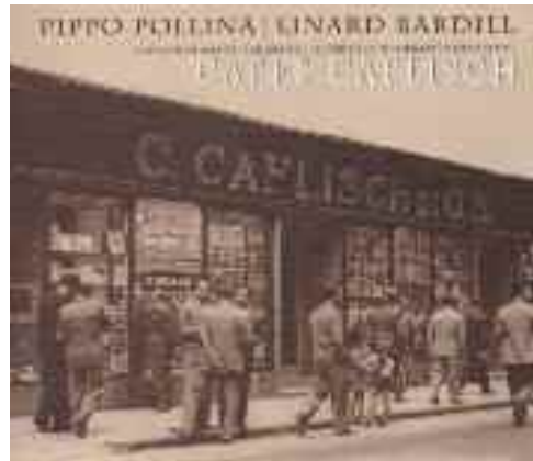
Fig. 18 - Caffè Caflisch