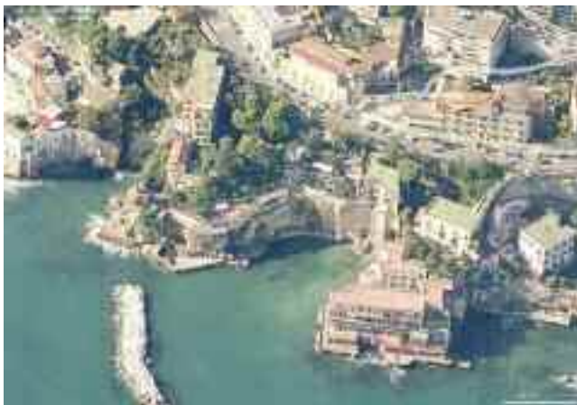
Fig. 10 - Grotta romana

Prima di proseguire il nostro percorso vorrei parlare del degrado di tante ville, le più fortunate divenute anonimi condomini, le altre in preda indifese alla caducità del tempo.