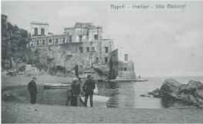
Fig. 11 - Villa Mazziotti in una antica cartolina

sbarrati. Come la Grotta Romana (fig. 10), ex tempio sacro, oggi sembra abitata da fantasmi. Antichissima, nacque come caverna preistorica, celebrata poi dai romani, infine dalla nobiltà. Diede il nome ad un famoso locale notturno, il luogo più ambito dal re d' Egitto Faruk, e da una giovane