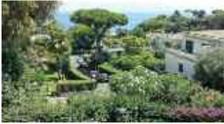
Fig. 17 - Parco Rivalta

Continuiamo il nostro percorso e ci imbattiamo in Parco Rivalta, una serie di ville che degradano verso il mare a valle di piazza Salvatore Di Giacomo.