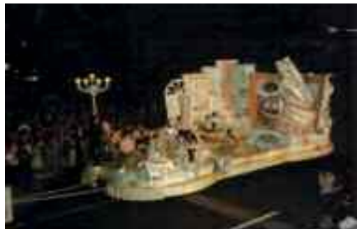
Fig. 7- Carro di Piedigrotta.

Il momento d'oro della festa fu durante il regno di Achille Lauro, quando la Piedigrotta durava molti giorni, altamente organizzata dal mitico assessore Limoncelli, quello del famoso slogan elettorale: "Torneranno i tempi belli se votate Limoncelli".