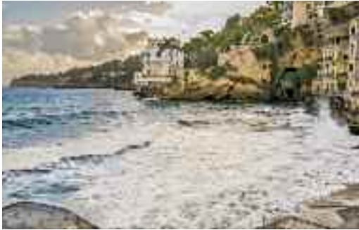
Fig. 12 - Villa Martinelli

sbarrati. Come la Grotta Romana (fig. 10), ex tempio sacro, oggi sembra abitata da fantasmi. Antichissima, nacque come caverna preistorica, celebrata poi dai romani, infine dalla nobiltà. Diede il nome ad un famoso locale notturno, il luogo più ambito dal re d' Egitto Faruk, e da una giovane