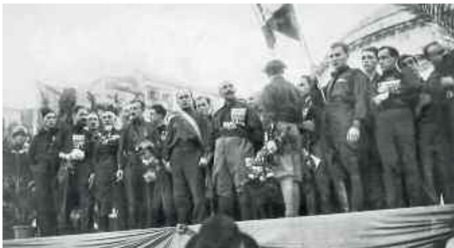
Inaugurazione del parco virgiliano di Napoli: adunata con Mussolini

di inseguire le griffe alla moda imitate in maniera prodigiosa e spacciate per vere.