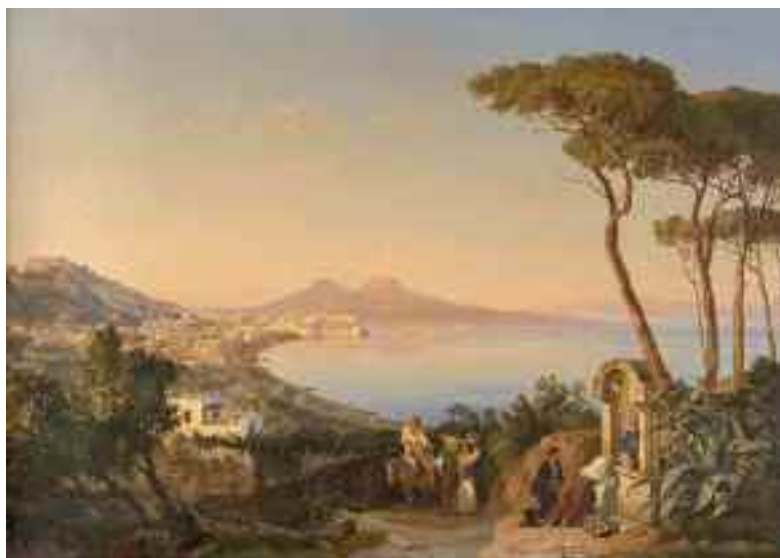
Fig. 8 - Carl Goetzloff-Napoli da Posillipo - Italia, collezione privata