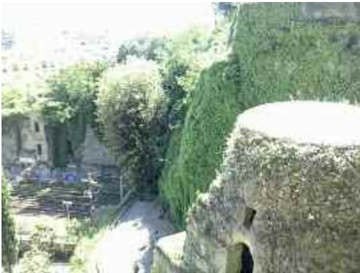
Fig. 3 – Veduta metropolitana