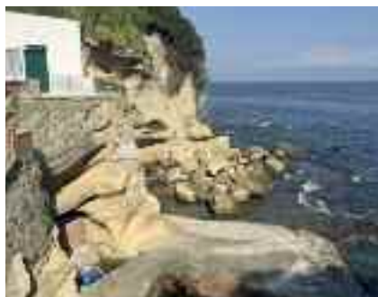
Fig. 9 - Il mare che lambisce il parco Sud Italia