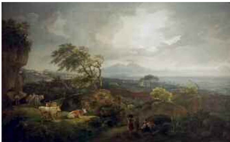
Fig. 10 - Salvatore Fergola - Veduta della collina di Posillipo da Coroglio Napoli, museo di Capodimonte