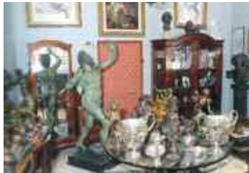
Fig. 7 - Fonderia Gemitto

Tra i numerosi prodotti posti in vendita, gli articoli che incontrano più successo sono i vasi di varie fogge e dimensioni, di terre refrattarie, destinati al giardinaggio e l'oggettistica di graffito su smalto a due colori. La signora Panadisi, affabile conversatrice, difende l'indirizzo culturale del suo laboratorio che rifugge dal facile cromatismo squillante e predilige la severità dello smalto bicolore.