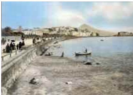
Fig. 1 - Mergellina nell'Ottocento

Celebrata nei secoli per la sua bellezza da pittori e poeti, la zona è stata completamente modificata dalle colmate che hanno avanzato la linea costiera nella seconda metà del XIX secolo, trasformando l'antica via Mergellina, che correva lungo la riva del mare a partire dalla Riviera di Chiaia, in una strada interna su cui affacciarono i nuovi palazzi di stile eclettico del viale Elena, oggi viale Gramsci.