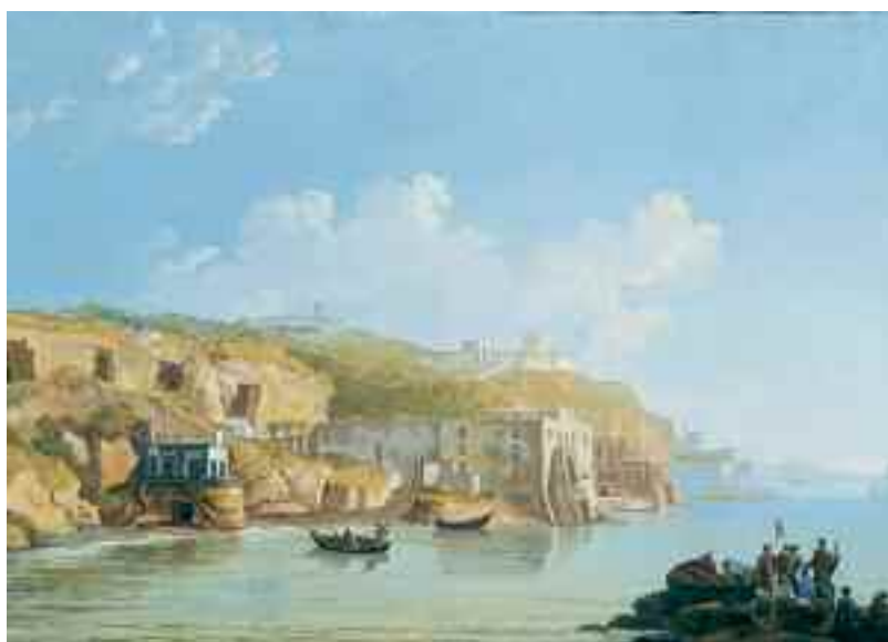
Fig. 11 - Salvatore Gentile - Veduta di Posillipo