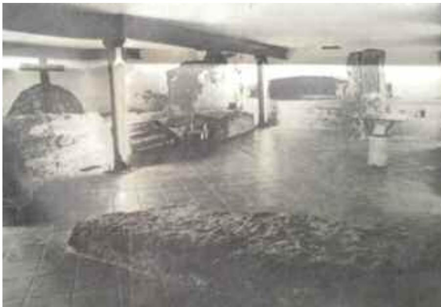
Fig. 10 - Napoli chiesa di S. Maria della Consolazione a Villanova (cripta)

intonacata, frammenti di lesene cinquecentesche scolpite” e ancora decorazioni parietali che conservano il colore ed una lapide marmorea con stemma e sedile di pietra (fig. 10). Sulla tomba si legge chiaramente Ioannes neapolitanus ... 1545. Finalmente una data certa, oltre al pavimento della cripta simile a quello cinquecentesco della chiesa di San Giovanni a