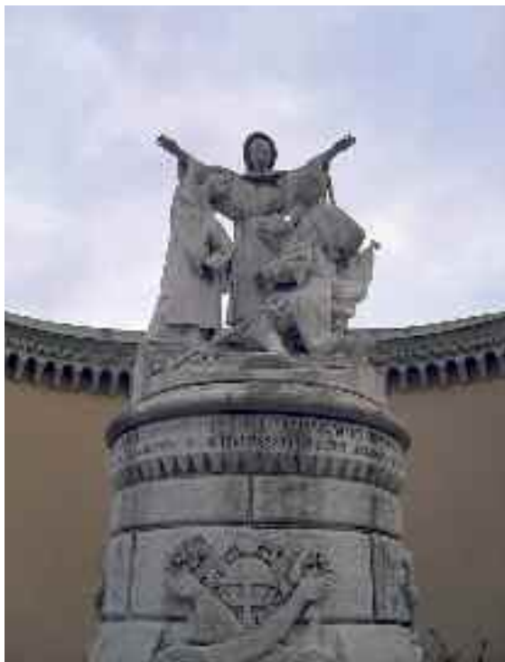
Fig. 39 - Scultura di Stanislao Lista

la conseguente fuga del marito della stessa verso Madrid nel 1648. L'edificio rimasto incompiuto assunse lo spettacolare fascino di una rovina antica confusa fra i resti delle ville romane che caratterizzano il litorale di Posillipo e fra gli anfratti delle grotte. Nell'interno, di notevole interesse è il teatro (fig. 41), aperto verso il mare e dal quale si gode un bel panorama