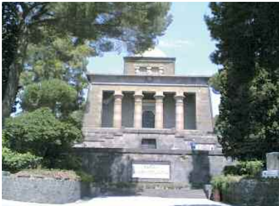
Fig. 1 - Mausoleo Schilizzi

Abito da mezzo secolo a Posillipo, ma solo ieri sono riuscito a visitare il mausoleo Schilizzi, l'originale monumento funebre in stile egizio, con annesso parco, che, con piccoli lavori di manutenzione, potrebbe trasformarsi in una interessante attrazione turistica, oltre a costituire un corroborante polmone di verde per la popolazione alla disperata ricerca di giardini dove trascorrere ore liete.