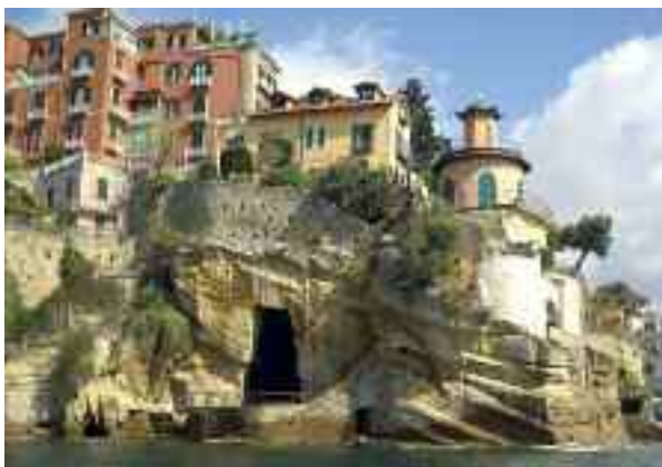
Fig. 32 - Villa Roccaromana

Poco distante dalla villa dei piaceri vi è