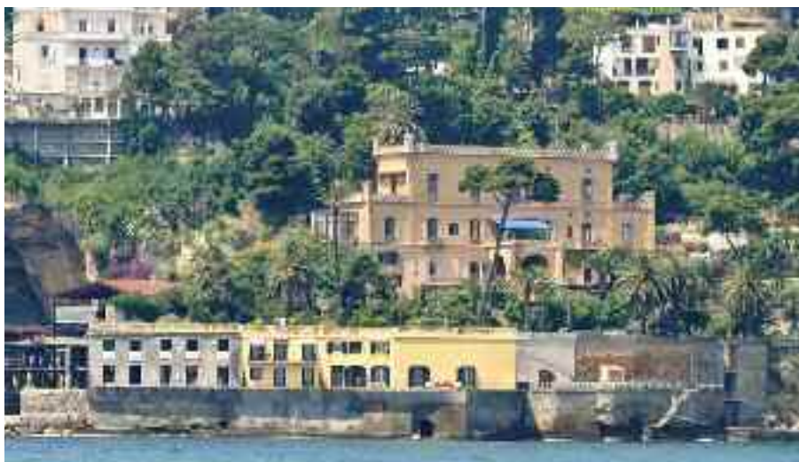
Fig. 25 - Villa Gallotti