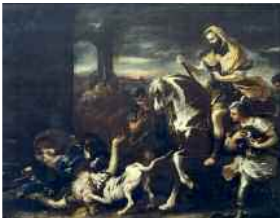
Fig. 1 - Luca Giordano-Jezabel divorata dai cani

“Intendevo visitare il mio teatro personale”.