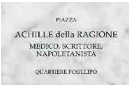
Fig. 48 - Targa Achille

Il viaggio si conclude in gloria con un breve accenno alla modesta villa (fig. 47) che dal 1980 è la mia casa, dolce casa: 5 piani, 800mq, 1000 di giardino. L'indirizzo? Lo potete leggere da soli (fig. 48).