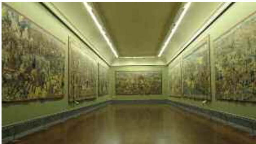
Fig. 29 -Sala degli arazzi, museo di Capodimonte

prediletta. In cambio mi presentò alcune nobildonne di gentile aspetto e di facili costumi con le quali trascorsi ore liete e produttive, stando però attento a non riprodurmi.