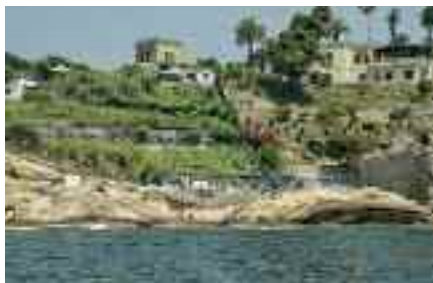
Fig. 1 - Villa imperiale

Parlare di uno stabilimento balneare del passato con una punta di malinconia può sembrare fuori luogo in un momento storico per Napoli caratterizzato da una vera e propria Caporetto sul fronte della balneazione, dalla mappatella beach di via Caracciolo alla spiaggia di Coroglio, trasudante in egual misura di amianto e monnezza, mentre l'acqua dove immergersi varia tra il giallo ed