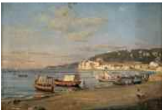
Fig. 30 - Teodoro Duclère - Mergellina Sorrento, museo Correale