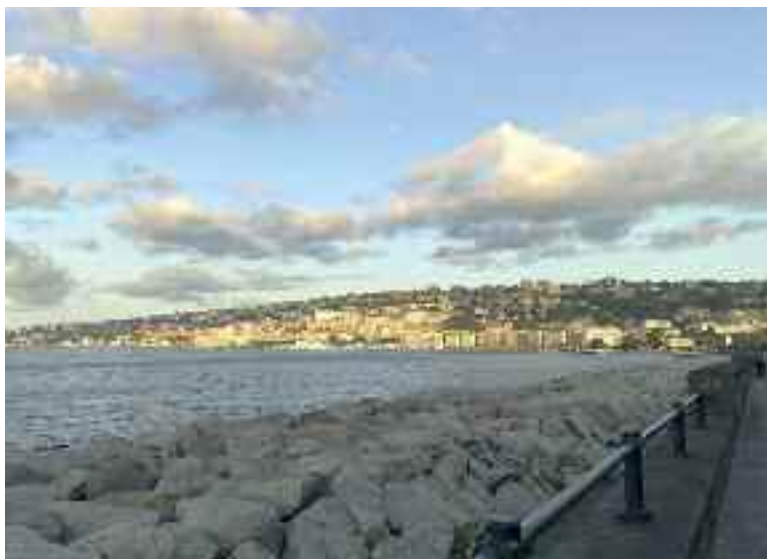
Fig. 3 - Scogliera

chiusa al traffico e dedicata allo svago dei cittadini la domenica. Attualmente, la strada è aperta al transito veicolare in entrambe le direzioni con due corsie per senso di marcia con annessa pista ciclabile sul lato mare. Il tratto di strada che va da Piazza della Repubblica fino alla confluenza di Viale Dhorn (comunemente chiamata “rotonda Diaz”), è dal 6 maggio 2013 area pedonale. A metà percorso si apre la rotonda Diaz, un ampio spazio circolare detto così per la presenza del monumento equestre al generale Armando Diaz, opera del 1936 di Francesco Nagni e Gino Cancellotti, af-