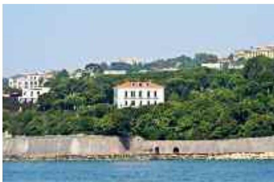
Fig. 21 - Villa Rosebery

Tutti assieme ad ipotizzare degli scenari di risanamento per la realtà napoletana che in passato fu faro del pensiero umano da Gian Battista Vico a Benedetto Croce.