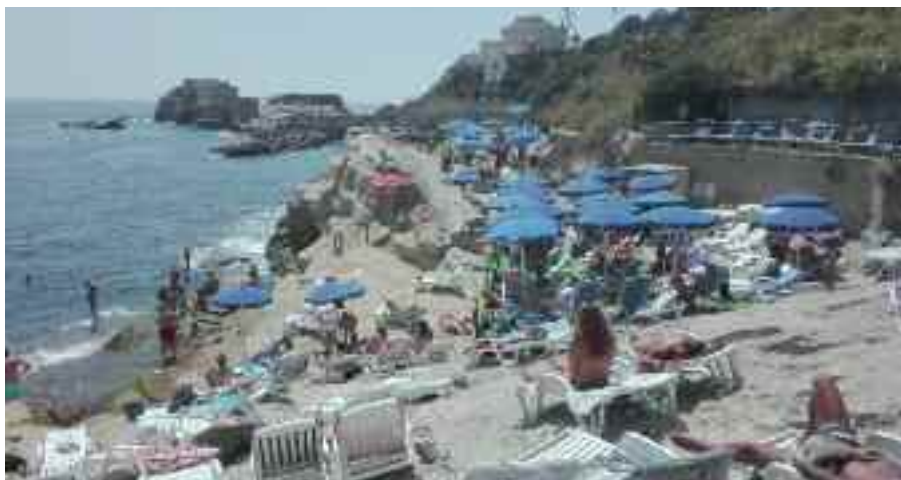
Fig. 5 - Villa Imperiale

Non parleremo di Villa Imperiale (fig. 5) per la quale invito i lettori a leggere il mio articolo riguardante l'accorsato stabilimento balneare: Com'era bella villa Beck (consultabile su internet digitandone il titolo).