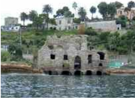
Fig. 2 - Palazzo degli spiriti