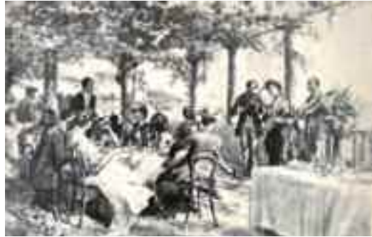
Fig. 4 - Lo Scoglio di Frisio in un disegno di Edoardo Matania

Esso sorse nel 1850, quando Ferdinando Autiero, gestore da anni di una taverna riuscì ad affittare per un prezzo astronomico un grande salone vicino a Palazzo Donn'Anna, di proprietà del duca di Frisio, da cui il nome dato al nuovo ristorante.