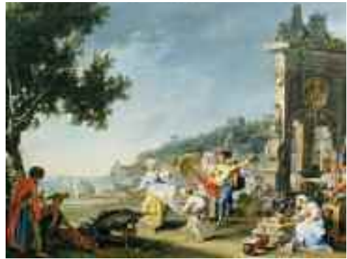
Fig. 33 - Filippo Falciatore Tarantella a Mergellina Detroit, The Institute of Arts