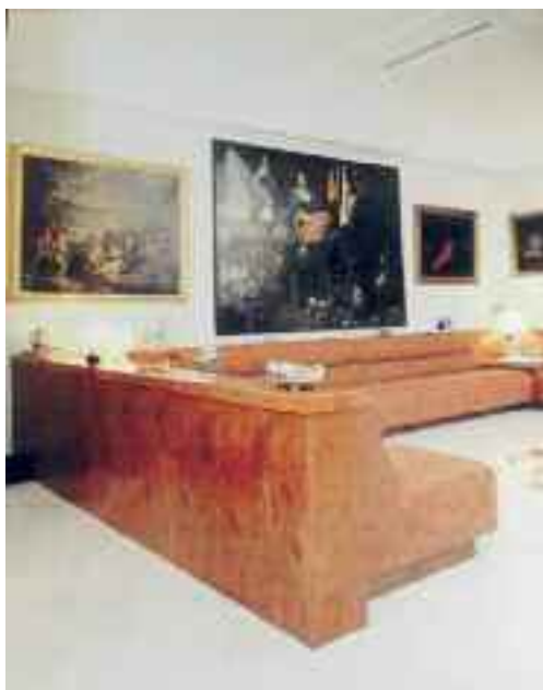
Fig. 47 - Salotto villa della Ragione

Passiamo ora a villa Ruffo della Scaletta (fig. 46). Vi si accede da via Petrarca 40 e attraverso una lunga rampa da via Posillipo 204 a monte dell'accesso a villa Craven. Il corpo principale è rigorosamente neoclassico, mentre l'insieme degli elementi disseminati in giardino e lungo la rampa sono neogotici. Sono inoltre presenti una cappella e