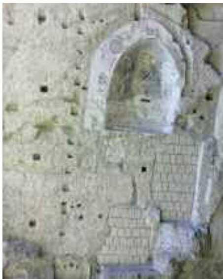
Fig. 7 - Affresco