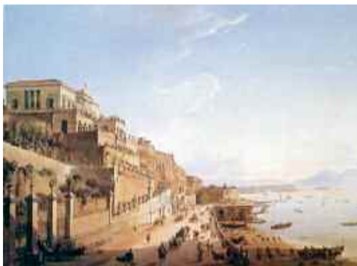
Fig. 13 - Frans Vervloet - La strada di Posillipo e Villa Doria d'Angri Napoli, collezione privata