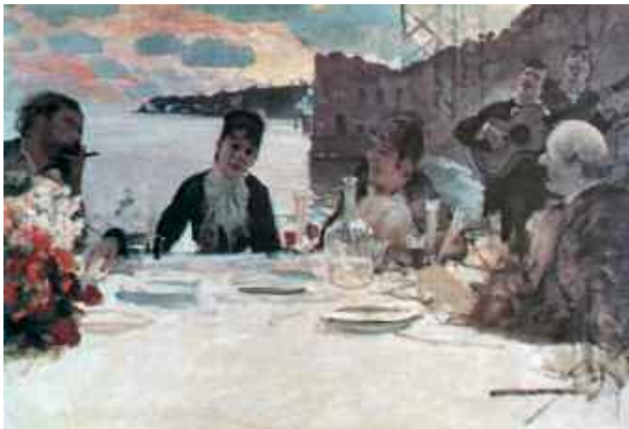
Fig. 18 - Giuseppe De Nittis - Il pranzo a Posillipo - Milano, Galleria d'Arte Moderna