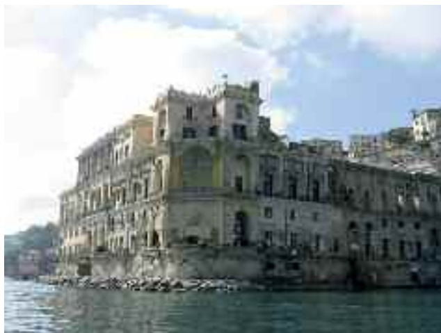
Fig. 42 - La casa abitata da Raffaele La Capria

La gentile signora abita col marito la mitica casa (fig. 42) di Raffaele La Capria, dotata di una spettacolare balconata fronte mare e l'anno scorso ha cortesemente accolto una sessantina di miei amici delle visite guidate, che organizzo ogni settimana. Tutti rimasero stupefatti, non solo per il pa-