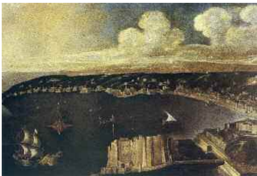
Fig. 1 - Didier Barra - Veduta di Napoli con Castel dell'Ovo e Posillipo Napoli, museo di San Martino

Cominciamo con Didier Barra, autore di una Veduta di Napoli con Castel dell'Ovo e Posillipo (fig. 1) conservata a Napoli nel museo di San Martino.