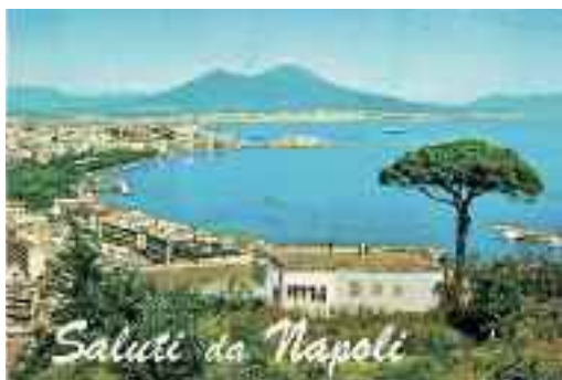
Fig. 7 - Cartolina

è giovane, avvertono i manuali, è a forma di piramide, ma da adulto è a guisa di ombrello. Può raggiungere un'altezza di trenta metri e può vivere fino all'età di oltre centoventi anni.