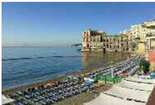
Fig. 15 - Bagno Elena

A cala Selvina, qualcuno provò ad aprire un locale al pubblico: attirò gli scafi dei contrabbandieri in gita domenicale. Chiuse presto. E Villa Rosebery? Chi provasse ad espugnarla s'imbatterà in motoscafi d'altura, carabinieri e polizia segreta, a guardia della residenza presidenziale. In quegli anfratti marini, cari ai viaggiatori del Nord e agli antichi romani, gli stabilimenti