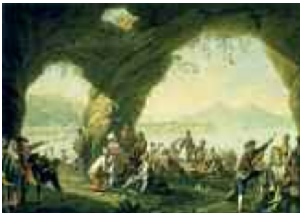
Fig. 34 - Pietro Fabris - Scena di vita popolare in una grotta a Posillipo Napoli, collezione privata