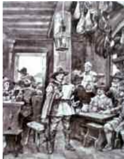
Fig. 1 - Giuseppe Aprea, Poeti nella taverna del Cerriglio

Ma la vera notorietà della taverna è legata all'agguato che tesero a Ca-