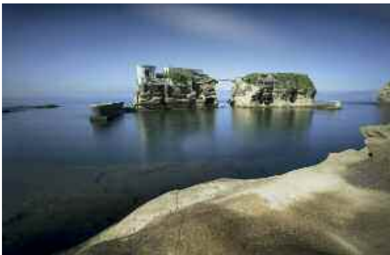
Fig. 3 - Isolotto della Gaiola

Negli anni, per fortuna dei napoletani e per sfortuna del nostro anfitrione, il monarca del grano incappò in una serie di disavventure giudiziarie, che si conclusero con l'esproprio delle sue proprietà, le quali, passate allo Stato, sono ora di godimento pubblico e sono visitabili ogni giorno, basta percorrere da via Coroglio, l'imponente Grotta di Seiano realizzata in epoca romana dall'architetto Lucio Cocceio, che fu riportata alla luce, riaperta e riadattata nel 1840 da Ferdinando II di Borbone. Il traforo, della lunghezza di circa 780 metri, attraversa la collina tufacea di Posillipo, collegando l'area di Bagnoli e dei Campi Flegrei con il Parco sommerso della Gaiola.