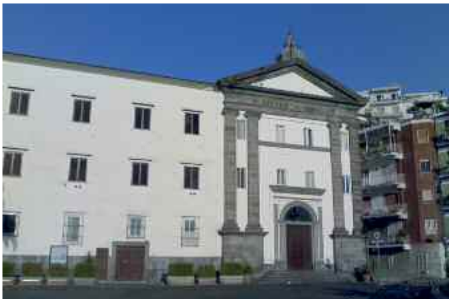
Fig. 2 - Chiesa di Sant'Antonio a Posillipo