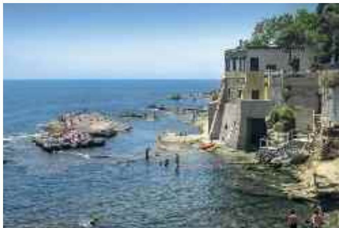
Fig. 6 - Villa Capasso