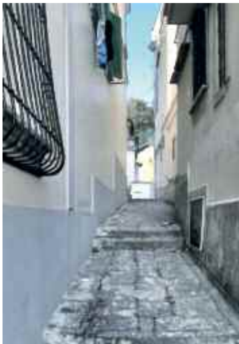
Fig. 11 - Napoli, inizio del Canalone

Nella pianta Carafa del 1775 sono già ben visibili i villaggi di S. Strato, Portaposillipo e Villanova ed il percorso dell'attuale via del Marzano, all'epoca chiamata Malfioccolo. Poco è cambiato da allora, una certa atmosfera paesana sopravvive in queste stradine e nella piccola piazza antistante la chiesa di Villanova, mentre da sempre il parroco, che conosce tutti, termina il suo ufficio con la frase: "la Messa è finita, andate in pace e buona serata".