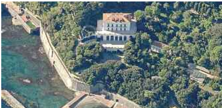
Fig. 22 - Villa Rosebery dal cielo