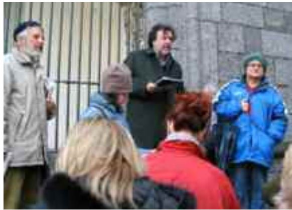
fig. 3 visita chiesa Monteoliveto

Nel corso di una di queste visite partimmo in 80 - 90 persone, ma dopo poche decine di minuti eravamo divenuti centinaia, per cui la direzione del museo, invidiosa del mio straordinario successo, fingendo di temere per l'incolumità dei dipinti esposti, inviò due carabinieri per scio-