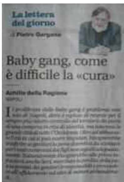
Il Mattino - 19 febbraio 2018, pag. 50

Oltre ad abbassare l'età in cui si può essere imputati, bisognerebbe trasferire automaticamente ai genitori la pena detentiva da scontare per i reati commessi dai figli non seguiti adeguatamente; naturalmente bisognerebbe alle prime infrazioni, anche lievi, esercitare la perdita della patria potestà e l'affidamento ad altri di minori abbandonati al loro triste destino.