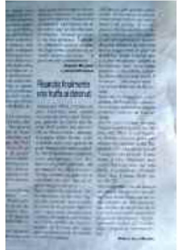
Il Roma 14 marzo 2019 segue dalla prima pagina