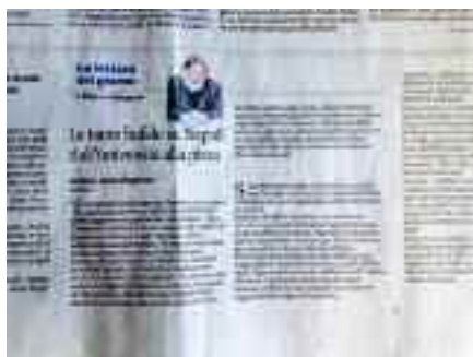
Il Mattino 5 settembre 2017

Peccato che se proviamo a chiedere ai massimi storici del periodo, da Feniello a Galasso, non tanto il nome dei primi professori, ma dove avesse sede la prestigiosa istituzione, nessuno è in grado di rispondere, a dimostrazione evidente che si tratta di una bufala, alla pari di tante altre che circolano sulla nostra storia, dalla presenza di decine di ampolle di santi, che fanno concorrenza al prodigio di San Gennaro, alla nascita della pizza margherita in epoca post unitaria in onore di una regina sabauda, quando la prelibata specialità è descritta accuratamente in famosi libri settecenteschi.