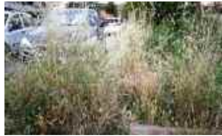
Giardini della Bufalotta

vetri ubiquitari, autobus sovraffollati, ma soprattutto spazzatura debordante e raccolta differenziata simbolica, con automezzi che mescolavano il contenuto dei vari recipienti, rendendo vano il sacrificio dei pochi cittadini che distinguevano la plastica e la carta, dall'umido e dal vetro.