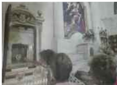
Chiesa San Gennaro - Pozzuoli, via Domiziana

Per il prestigio di San Gennaro sarebbe un brutto colpo, ma finalmente Napoli potrebbe entrare a testa alta nel mondo contemporaneo.