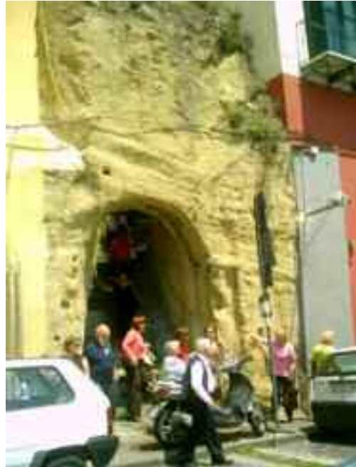
fig. 8 - All'uscita del Canalone