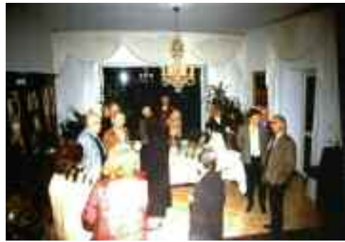
fig. 14 - Pasticcini preliminari

Dopo una sosta forzata nel 2008 la sua riapertura era attesa con spasmodica fibrillazione dai tanti amici del mercoledì, ansiosi di poter partecipare alle cerimonie del tempio del sapere e finalmente nel 2014 ha ripreso a funzionare a pieno ritmo di venerdì, abolendo le inutili abboffate, ora l'unico cibo è la cultura che elargisco personalmente con generosità e dovizia di particolari.