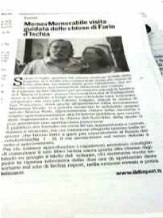
Il Dispari - 9 luglio 2019 pag.12

al fianco del conduttore (fig.1-2), il cui ascendente sul sesso debole è noto e sperimentato.