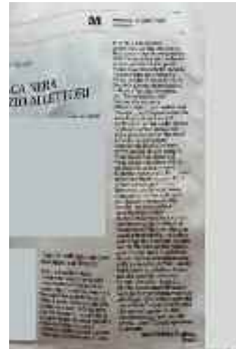
Il Mattino 10 luglio 2019 pag.42