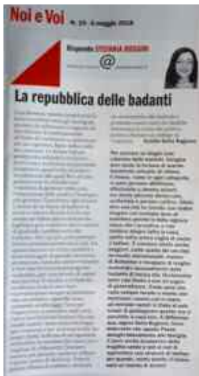
L'Espresso - 6 maggio 2018, pag. 105

Il Mattino 6 maggio 2018 – L'Espresso 6 maggio 2018