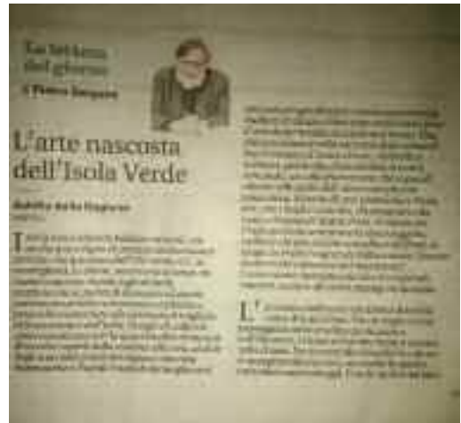
“Il Mattino 1 agosto 2017 pag 38”

L'eccessiva bellezza è un difetto di Ischia, come di tutto il Sud. Tra un bagno e un passeggiato nelle stradine profumate o sull'Epomeo, i visitatori farebbero bene