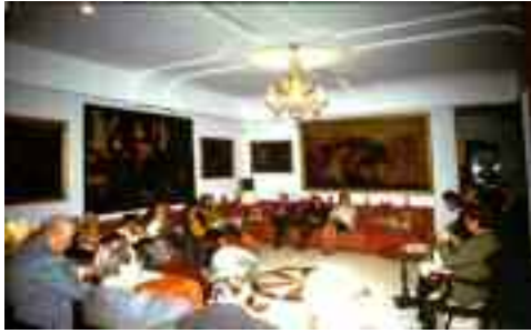
fig. 13 - Salotto della Ragione

mercoledì alle 17 una cinquantina di amici si riunivano negli eleganti saloni (fig. 13) della villa posillipina di donna Elvira e dopo aver consumato al piano superiore il fatidico the con annessi pasticcini (fig. 14), accoglievano l'ospite di turno, il quale avrebbe discusso per un paio d'ore su un argomento di cui era esperto, dalla letteratura all'arte, dalla storia di Napoli alla filosofia ed al cinema, per rispondere poi alle domande degli ascoltatori.