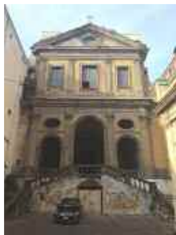
San Potito (facciata)

L'edificio si trova sulla sommità di una collina dove un tempo c'erano le fosse del Grano, in via Salvatore Tommasi, a ridosso di via Salvator Rosa. La chiesa, costruita nel Seicento, era parte di un complesso monastico, abitato dalle suore basiliane, poi benedettine, che durante il decennio francese furono cacciate, mentre il monastero fu trasformato in caserma.