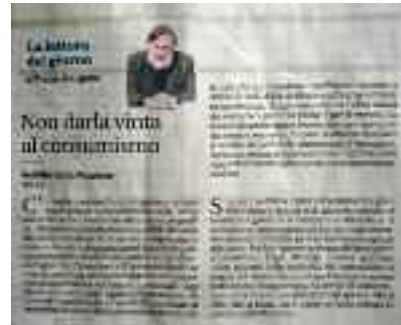
Il Mattino 3 aprile 2018