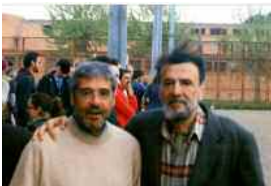
Achille con il senatore SALVATORE CUFFARO ex presidente della regione Sicilia

L'ex governatore della Sicilia Salvatore Cuffaro dopo aver scontato la condanna a sette anni per concorso esterno nel favoreggiamento alla mafia, oggi torna un uomo libero, lasciandosi alle spalle il carcere romano di Rebibbia. Finalmente finisce un doloroso calvario, percorso con cristiana rassegnazione e comincia una nuova vita tutta dedicata al prossimo. Infatti è sua ferma intenzione, subito dopo il periodo natalizio trascorso in famiglia, di partire per il Burundi e lì prestare la sua opera di medico in favore della derelitta popolazione africana, facendo tesoro della preziosa esperienza maturata a contatto con ergastolani senza speranza e con gli ultimi della terra, da tutti dimenticati, spesso anche dai propri cari. Una decisione che merita rispetto ed ammirazione.