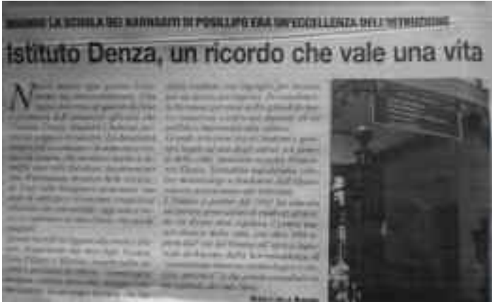
Il Roma - 7 marzo 2019 - pag. 12

e fondatore dell'Osservatorio astronomico del Vaticano.