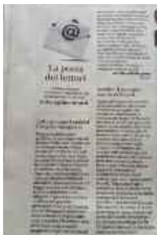
Il Mattino 2 aprile 2019 pag. 38

auto disponibili e non ci si attiva, l'indomani sarà presentata denuncia alla magistratura per omissione di intervento, si ottengono vaghe promesse, ma mai un sequestro delle attrezzature che emettono i rumori molesti, che oramai rendono la vita insopportabile in interi quartieri della città, non solo a Napoli, ma in tutti i centri urbani italiani.