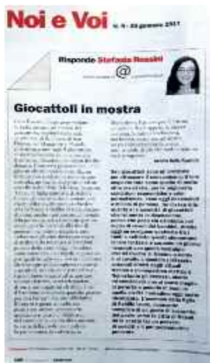
Articolo pubblicato sul settimanale L'ESPRESSO n.5 del 29 gen. 2017

Oggi i bambini sono sommersi dai regali, li spacchettano svogliatamente, ci giocano per qualche giorno e poi ne chiedono altri sempre più complessi e costosi a genitori, nonni, zie e parenti fino alla sesta generazione, i quali scioccamente fanno a gara ad acquistare trenini elettrici, automobili sofisticate, aerei teleguidati, animali mostruosi, droni e monopattini elettrici, tutti doni ai quali il bambino dedica qualche giorno e poi disgustato butta via insoddisfatto.