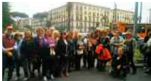
fig.11 - In piazza Sannazzaro 14 aprile 2018