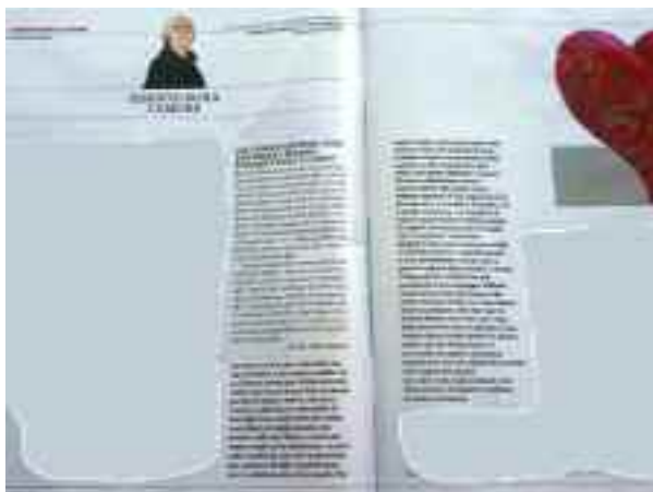
Venerdi di Repubblica 10 maggio 2019 - Rubrica Questioni di cuore - pag.10-11

Colpa degli scarsi investimenti per conciliare lavoro e famiglia per le donne? Verissimo.