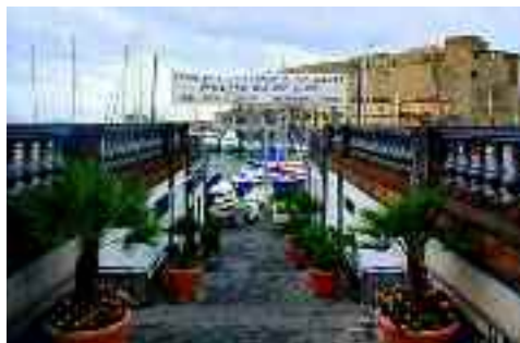
Ingresso del circolo Savoia

Il cemento che tiene assieme tante persone, in mancanza di un mazzo di carte è naturalmente il cibo, l'elemento unificatore per eccellenza della nostra società bulimica e crapulona. Il divieto di iscrizione per le donne è l'ulteriore segno di una mentalità medioevale e l'auspicio è che venga quanto prima abolito.