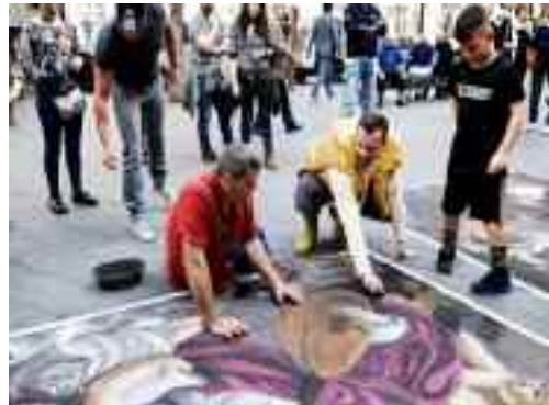
Napoli fashion on the road – Tappa 11 Info su www.napolifashion.it

“Se amate Napoli, ed intendete conoscerla nel profondo, sono certo che apprezzerete le mie pubblicazioni. Leggete e documentatevi costantemente. Non si finisce mai di imparare. Un caro saluto a tutti voi.”