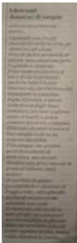
La Repubblica N - 29 marzo 2019 - pag. X

Privi di diritti ed oberati di doveri non conoscono però l'ego-