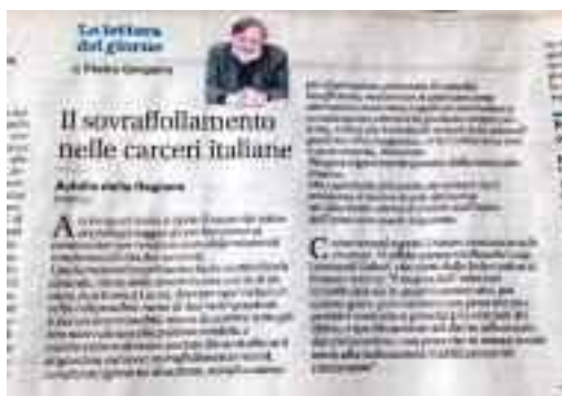
Il Mattino 12 settembre 2017 pag.42