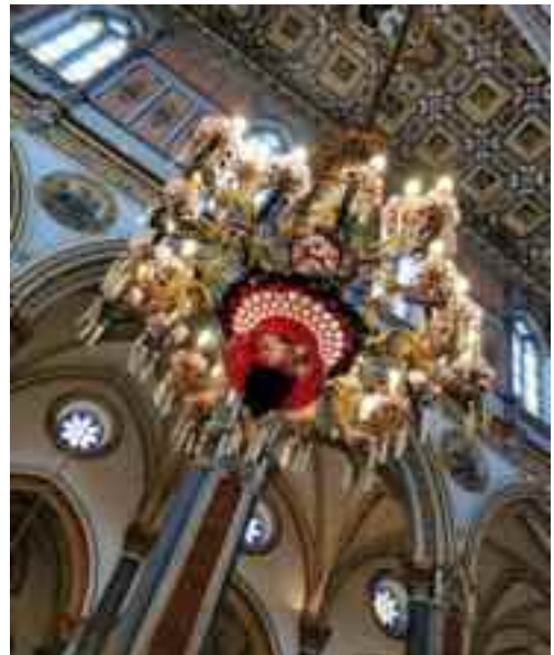
Cappella Sansevero, Napoli

Lei è un grande esperto di Caravaggio. Cosa ne pensa della nostra iniziativa di fusione culturale tra Napoli e Malta, all’insegna della celebrazione di Caravaggio, nella tappa 11 di Napoli fashion on the road, nostro progetto di marketing culturale itinerante nella città di Napoli?