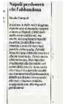
La Repubblica 30 giugno 2019 pagina 35

Vado via da Napoli perché per un giovane, soprattutto se laureato, non è possibile trovare un lavoro dignitoso, perché in città vi sono troppi furbi e disonesti, perché se la città è così malridotta la colpa è anche dei napoletani, perché tanti cittadini abbandonano per terra il sacchetto della spazzatura invece di metterlo nei contenitori, perché non posso sopportare la vista delle auto parcheggiate in quarta fila, perché non tollero che i guardiani nei musei chiacchierino ad alta voce tra di loro invece di stare attenti ai tesori loro affidati, perché non voglio pagare il pizzo se debbo parcheggiare, perché si discute solo di Maradona e del Napoli, perché sono stufo di vedere le strade piene di voragini invase dalla monnezza, perché il mare è ridotto ad una lurida cloaca, perché le aiuole non sono curate, i semafori ignorati, perché dalle finestre delle scuole non si vede il mare bensì orribili palazzoni, perché sono stanco di lottare ogni giorno per sopravvivere in questa giungla, vado via perché non ce la faccio più, anche se so che andandomene la città perderà un altro soldato che combatta per l'ultima speranza di riscatto.