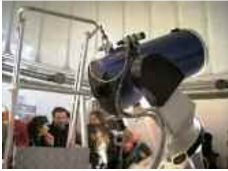
fig. 7 -Achille della Ragione all'Osservatorio astronomico - 14 gennaio 2005