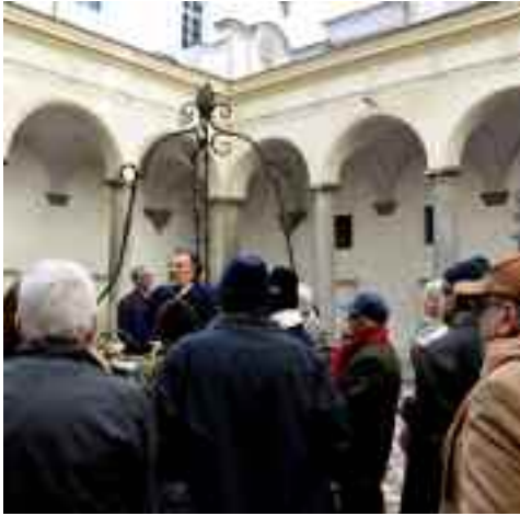
fig. 12 - Nel chiostro dei Girolamini