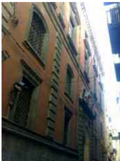
Facciata del palazzo vista da Spaccanapoli