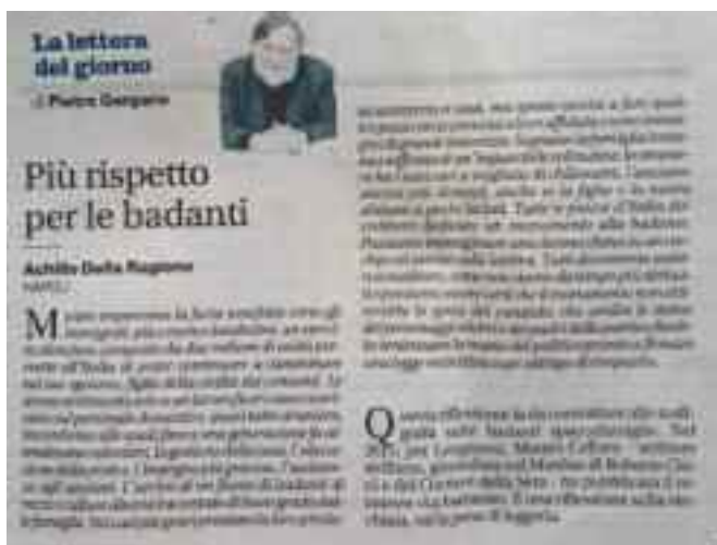
IL MATTINO 6 maggio 2018, pag. 54