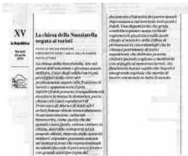
La Repubblica 23 aprile 2019, pag XV

La Repubblica 23 aprile - Il Mattino 21 maggio 2019 con il titolo. “Quanti ostacoli per visitare una chiesa”