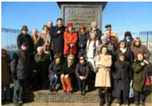
fig. 1 - Portici, museo ferroviario 20 gennaio 2008

Tra le visite del passato che meritano di essere ricordate vi è quella nella quale feci da Cicerone a big della cultura italiana dell'epoca: Giulio Andreotti, Umberto Eco, Marcello Dell' Utri, Oliviero Diliberto e tanti altri vip che ebbero l'onore di vi-