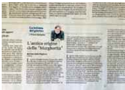
IL MATTINO 28 settembre 2017

Condita con pomodoro, mozzarella e basilico, che rappresentavano la bandiera italiana, delle tre pizze create per l'evento, la Margherita fu la più apprezzata dalla regina. la legenda, perché di questo si tratta, la troviamo dovunque. Ma Raffaele Esposito non inventò la pizza tricolore, la fece semplicemente conoscere alla sovrana piemontese, Già nel 1849, infatti, il filologo Emmanuele Rocco, nel capitolo "Il pizzaiolo" di "Usi e costumi di Napoli e contorni descritti e dipinti", coordinato da Francesco de Bourcard, parlò di combinazioni di ingredienti vari, tra i quali basilico, "pomodoro" e "sottili fette di mozzarella". E le fette disegnavano verosimilmente il celebre fiore di campo caro agli innamorati su una pizza che Raffaele Esposito avrebbe proposto 40 anni dopo alla regina sabauda