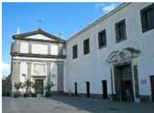
L'ingresso al complesso certosino di Napoli