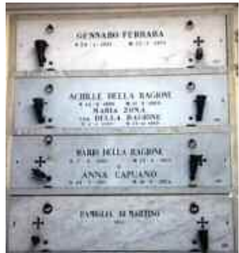
Nicchia della famiglia della Ragione

Personalmente, forse perché possiedo una nicchia di famiglia (fig.1), desidero lasciare ai posteri un segno del mio passaggio terreno, con la segreta speranza che in futuro, migliorate le tecniche di clonazione, qualche discendente deciderà di farmi rivivere, donando all'umanità un nuovo Achille della Ragione.