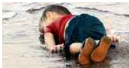
Corpicino senza vita

Dopo la foto del migrante morto asfissiato nel cofano motore di un'automobile, mentre cercava disperatamente di raggiungere la terra promessa, da ieri girano sui mass media mondiali le foto choc del bimbo annegato sulla spiaggia di Bodrum in Turchia, mentre anche lui anelava ad un futuro migliore. Un'immagine che ammutolisce, ma non si può rimanere in silenzio, bisogna urlare tutto il dolore e la rabbia, sperando di arrivare ai potenti che governano un mondo attento unicamente al pil, un'Europa che ha inventato il diritto d'asilo, che per secoli ha sognato e propugnato eguaglianza e fraternità, che ha predicato e praticato la carità e che oggi pensa solo ad amministrare l'egoismo e l'indifferenza. Quel tenero corpicino senza vita deve illuminarci, è tempo di decisioni coraggiose che tutti dobbiamo prendere, dobbiamo sognare una società dove regnano regole diverse, per non svegliarci in un mondo da incubo.