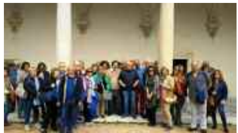
fig. 12c -Museo di San Martino 4 maggio 2018