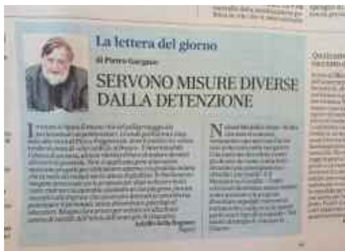
Il Mattino 31 luglio pag.38

Anche quest'anno in piena estate si ripete il mesto rito del pellegrinaggio dei parlamentari ai penitenziari per rendersi conto delle miserevoli condizioni di vita dei carcerati. Grande pubblicità è stata data dalla stampa alla visita del potente ministro Fico all'inferno di Poggioreale, dove il politico alla moda ha voluto rendersi conto di persona "Che caldo fa al fresco!"