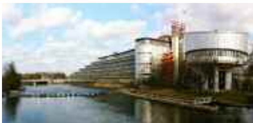
European Court of Human Rights

Ma il record dei ritardi spetta al sottoscritto, il quale attende una pronuncia della Corte europea dal 2009, dopo che il suo ricorso era stato dichiarato ricevibile (capita in meno del 3% dei casi). Nel frattempo ho espiato interamente una pena degna di un boss e se prima o poi arriverà l'attesa decisione allo Stato questo ritardo costerà circa un milione di euro di risarcimento, che saranno naturalmente devoluti in beneficenza