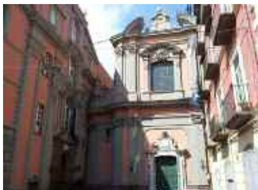
Chiesa della Santissima Annunziata, Pizzofalcone- Napoli

Il Mattino 26 febbraio 2017 – Il Fatto quotidiano 28 febbraio 2017