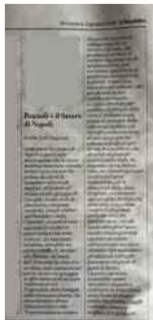
La Repubblica N 9 giugno 2019 - pag. 22

Questa è l'unica soluzione attuabile, perché eliminare l'inquinamento è troppo costoso, mentre un porto turistico troverebbe subito investitori disposti a co-