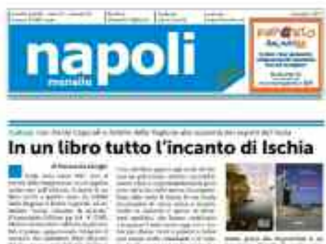
“NapoliMensile” in distribuzione con Il “Roma” da giovedì 7 settembre

Per fare un esempio, basti citare la rarità conservata nella sacrestia della Chiesa di San d’Assisi a Forio, visitabile soltanto su richiesta, gratuitamente, grazie alla disponibilità di un francescano. Si tratta di quadro originale, una Pietà da attribuire a Mattia Preti, del quale una copia, realizzata da un allievo di Preti, è in esposizione al Museo del Prado. È solo uno dei tanti tesori da scoprire su un’isola che, appena due anni fa, nel 2015 ha registrato quasi tre milioni e seicentomila presenze, che non conoscono affatto, o solo in maniera residuale, le bellezze, le risorse architettoniche, storiche, urbanistiche e artistiche dell’isola. Un’isola d’arte, raccontata in maniera precisa e accessibile da Achille della Ragione e Dante Caporali con garbo e competenza.