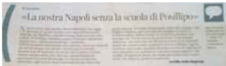
Corriere della sera - 10 marzo 2019 - pag. 27

Grande delusione tra ex studenti e genitori legati ad uno degli istituti più famosi della città, intitolato a padre Francesco Denza, barnabita napoletano, celebre meteorologo