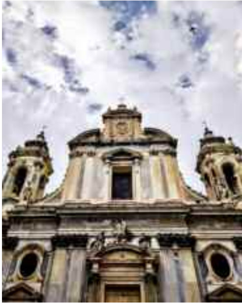
Chiesa dei Girolamini, Napoli

“Un plauso all’iniziativa “Napoli fashion on the road”. Ho molto apprezzato questa fusione culturale tra Napoli e Malta, utilizzando l’antica arte dei Madonnari per celebrare l’immenso Caravaggio. Napoli e Malta furono due tappe fondamentali della sua incredibile esistenza.