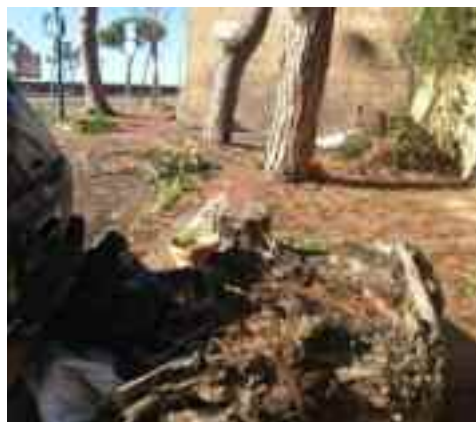
Napoli - via Manzoni