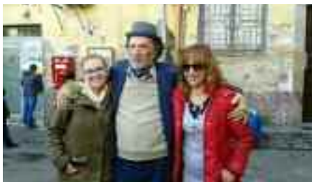
fig. 10 - Achille con due seguaci

tevi abbiamo una volante a pochi metri interverrà immediatamente”. Ed infatti pochi minuti e sul posto vi erano quattro esponenti delle forze dell’ordine di cui uno alto due metri. Nel frattempo era intervenuto anche il parroco ed alcuni delinquenti chiamati dai custodi. Chiesi perentorio di identificare quei volti patibolari che cercavano di intimidirmi, li avrei denunciati alla magistratura e soprattutto li avrei fatti licenziare dal sindaco, del quale sono amico. Il custode arrossì per lo spavento ed il parroco prese le sue difese affermando: “Illustre professore, se questo delinquente vi chiede