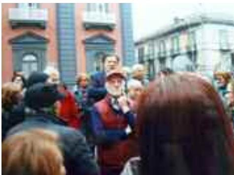
fig. 12b -Chiesa di San Potito 10 marzo 2018

scusa e vi bacia la mano siete disposto a perdonarlo?”. “Certamente e ci faremo assieme anche una pizza”. A questo punto uno dei carabinieri chiese: “Maestro facciamo da anni servizio nella zona e non abbiamo mai visitato la chiesa, possiamo unirvi alla vostra visita?” “Accomodatevi” risposi tanto nella zona i criminali non esistono.