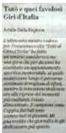
La Repubblica - 1°giugno 2019, pag. 31

La Repubblica 1 giugno 2019 - Mattino 14 giugno 2019