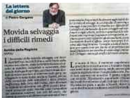
Il Mattino - 12 aprile 2018