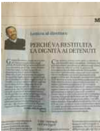
Il Mattino 15 aprile 2019 - pag. 38

Ne ho parlato tra i detenuti di Poggio- reale, raccogliendo decine di entusiasti-