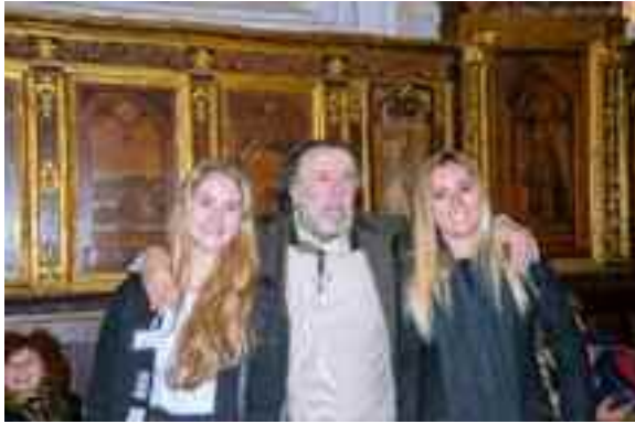
fig. 2 - Achille con due allieve

poi, immancabile, la presidentessa del Soroptimist o un presidente di un Rotary o di un Lions, che mi imploravano di ammaestrare i loro iscritti.