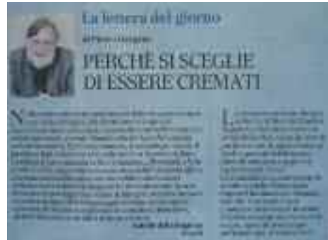
Il Mattino - 5 settembre 2018, pag. 38