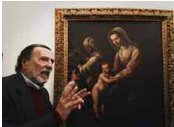
Achille Della Ragione

Abbiamo intervistato il Prof. Achille Della Ragione, critico d'arte ed istrionico e vulcanico promotore di napoletanità. Un uomo che da anni è costantemente impegnato in profonde ricerche sulla città di Napoli, spaziando tra vicende storiche, artistiche, miti e riti. Incessante attività di ricerca che sfociata in una considerevole mole di pubblicazione di libri, oltre che nella condivisione di preziosi documenti digitali, facilmente reperibili in Rete.