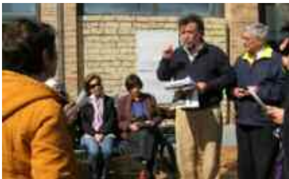
fig. 4 -Citta della Scienza - 20aprile 2008

glie l'assembramento. I due militari quando giunsero al mio cospetto si accorsero con grande meraviglia che, alla mia destra vi era il procuratore generale della Repubblica ed alla mia sinistra il Questore, per cui non osarono fiatare. Io li affrontai baldanzoso: "Ecco altri due visitatori, mettetevi in fila e cercate di imparare qualcosa".