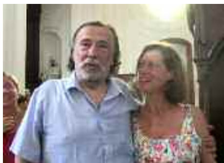
Popputa ammiratrice di Bolzano