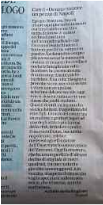
Il Mattino 21 marzo 2019 - pag. 42

L'Istituto a partire dal 1943 ha educato ed istruito generazioni di studenti ed inoltre da alcuni anni ospitava il primo museo etrusco della città, con oltre 800 reperti dall'età del bronzo all'epoca imperiale dichiarata dalla Sovrintendenza di "eccezionale