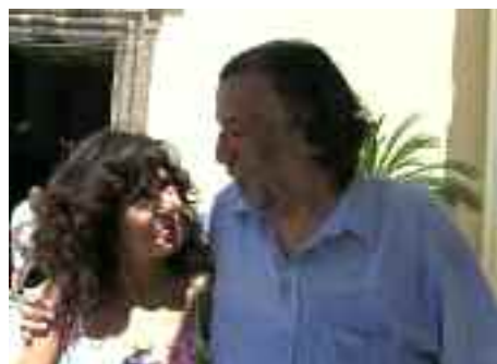
La mitica presidentessa del Clubino