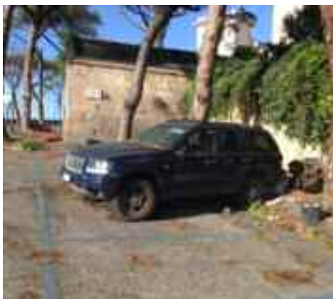
Napoli - via Manzoni