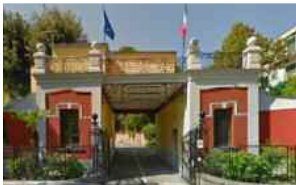
Ingresso Istituto Denza

Napoli muore ogni giorno lentamente ma inesorabilmente. Una tappa dolorosa di questo declino è costituita dall'annuncio ufficiale che l'Istituto Denza chiuderà i battenti perché da tempo è in passivo. La denatalità sempre più accentuata e la mancanza cronica di denaro, che avvilisce anche le famiglie una volta facoltose, ha provocato una diminuzione drastica delle iscrizioni. Una volta bisognava prenotarsi con anni di anticipo e vi era una scrupolosa selezione del ceto sociale; oggi non si riesce a radunare in una classe che pochi studenti.