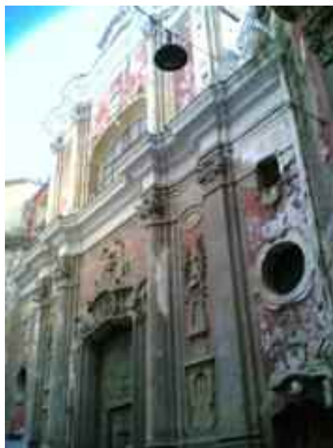
NAPOLI: Chiesa di Santa Maria Vertecoeli (chiusa dal 1980)