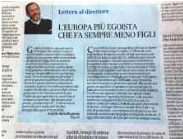
Il Mattino 11 maggio 2019, pag. 42

Certo ci vorrebbero più asili, orari flessibili, servizi di sostegno e permessi speciali. Ma anche nei paesi europei dove si spendono più denari per la famiglia non si assiste certo a un boom della natalità,