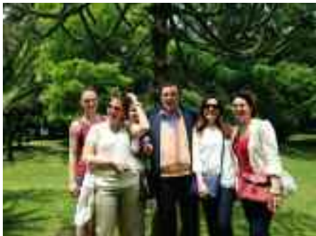
fig. 9 - Achille con le sue followers

tevi abbiamo una volante a pochi metri interverrà immediatamente”. Ed infatti pochi minuti e sul posto vi erano quattro esponenti delle forze dell’ordine di cui uno alto due metri. Nel frattempo era intervenuto anche il parroco ed alcuni delinquenti chiamati dai custodi. Chiesi perentorio di identificare quei volti patibolari che cercavano di intimidirmi, li avrei denunciati alla magistratura e soprattutto li avrei fatti licenziare dal sindaco, del quale sono amico. Il custode arrossì per lo spavento ed il parroco prese le sue difese affermando: “Illustre professore, se questo delinquente vi chiede