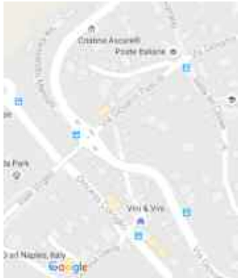
Napoli - via Manzoni

Ho segnalato da tempo la cosa a Polizia, Carabinieri, Vigili urbani e Guardia di Finanza senza nessun risultato. Prima di provare con Vigili del fuoco, Forestale ed eventualmente la Protezione civile, provo ad informare la stampa, sperando nel miracolo della sua rimozione, soprat-