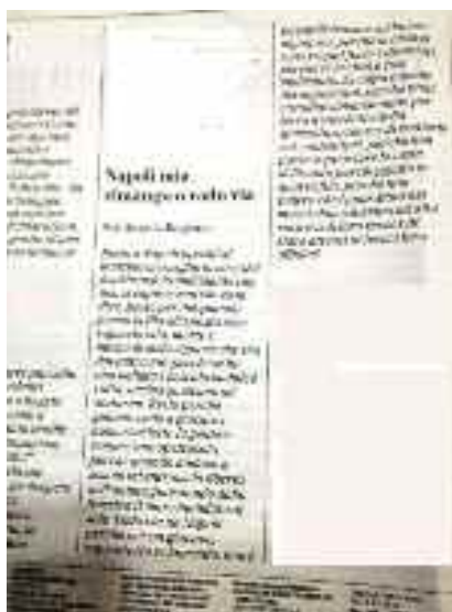
La Repubblica 29 giugno 2019 pagina 31

Resto perché se passa un carro funebre ci scambiamo sguardi solidali e facciamo le corna; perché io e i miei amici facci! amo la raccolta differenziata e usiamo detersivi biologici; perché quando a tarda sera, in primavera, salgo a Posillipo e il profumo del mare e degli oleandri mi riempie di gioia, piango e penso che non è vero che la camorra ha ammazzato Napoli, che non dovrò andare via per sempre.