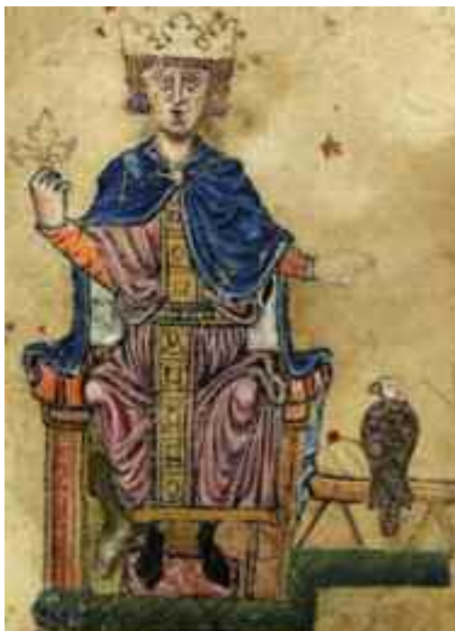
Federico II di Svevia

Peccato che se proviamo a chiedere ai massimi storici del periodo, da Feniello a Galasso, non tanto il nome dei primi professori, ma dove avesse sede la prestigiosa istituzione, nessuno è in grado di rispondere, a dimostrazione evidente che si tratta di una bufala, alla pari di tante altre che circolano sulla nostra storia, dalla presenza di decine di ampole di santi che fanno concorrenza al prodigio di San Gennaro, alla nascita della pizza margherita in epoca post unitaria in onore di una regina sabauda, quando la prelibata specialità è descritta accuratamente in famosi libri settecenteschi.