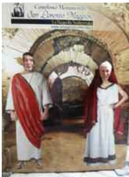
fig. 5 - Achille e signora sotto terra

Tra gli episodi più recenti voglio ricordare uno avvenuto l'anno scorso al museo archeologico, quando le guide autorizzate chiamarono i vigili urbani per mettere fine alla mia visita, scambiandomi per un abusivo. Io spiegai loro con santa pazienza che ero in un luogo pubblico con i miei amici, i quali avevano pagato il biglietto di ingresso, ma non versavano niente nelle mie tasche per le mie spiegazioni, che tra l'altro sono impagabili. Spiegai loro che nessuno mi poteva impedire in un luogo pubblico di parlare e che se avessero insistito ad importunarmi avrei chiamato i carabinieri per identificarli e li avrei denunciati per stalking.