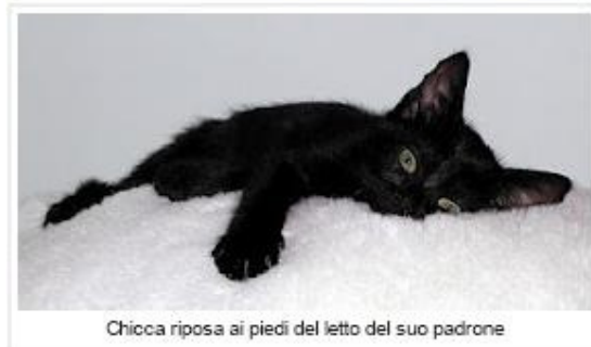
Chicca riposa ai piedi del letto del suo padrone