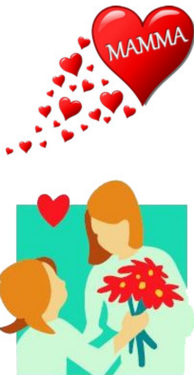
festa della mamma

Una giornata particolare, allietata dal sole prima di tornare nel buio delle celle.