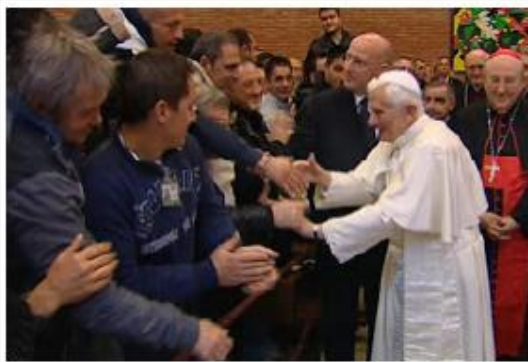
Benedetto XVI a Rebibbia

Sicuro di interpretare le richieste di tutti i compagni di pena, anche se non sarò io ad avere il privilegio di parlargli, vorrei semplicemente dirgli: "Santità, le sue preghiere sono ben più potenti delle nostre. Faccia che la Giustizia divina, infallibile, illumini quella terrestre, spesso fallace, e la sua invocazione venga ascoltata non solo nell'alto dei cieli, ma anche nelle aule sorde e grigie del Parlamento, il quale, pur impegnato da pressanti problemi di natura economica, trovi il tempo e la volontà di varare un indifferibile provvedimento di clemenza, che permetta di sfollare le carceri e restituire ai detenuti, ridotti al rango di bestie, la dignità di uomini.